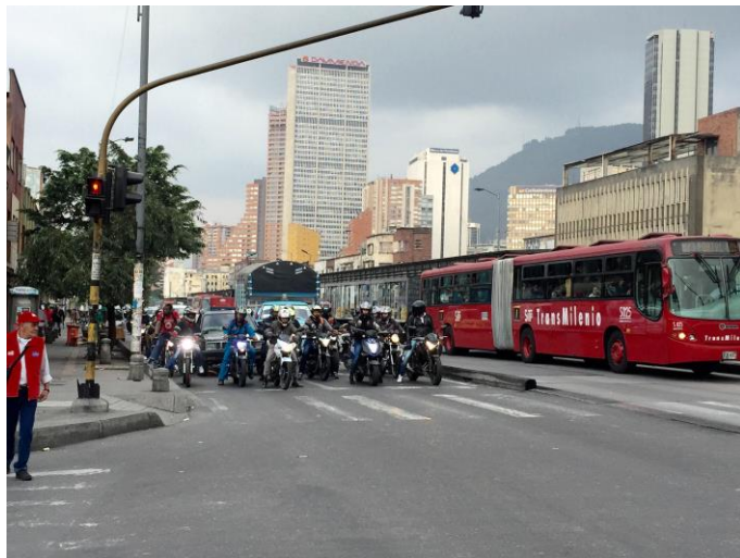
Av Caracas con calle 22

Si permitimos a las motocicletas avanzar en bloque y a la vez que tomen distancia de los carros, disminuirémos el mortal zig zag que se produce entre los vehículos, además, esta norma debe estar acompañada de una campaña pedagógica dirigida a todos los actores que hacen uso de la vía pública, incluidos peatones, motociclistas y conductores de automóviles; agregó el cabildante Martínez.