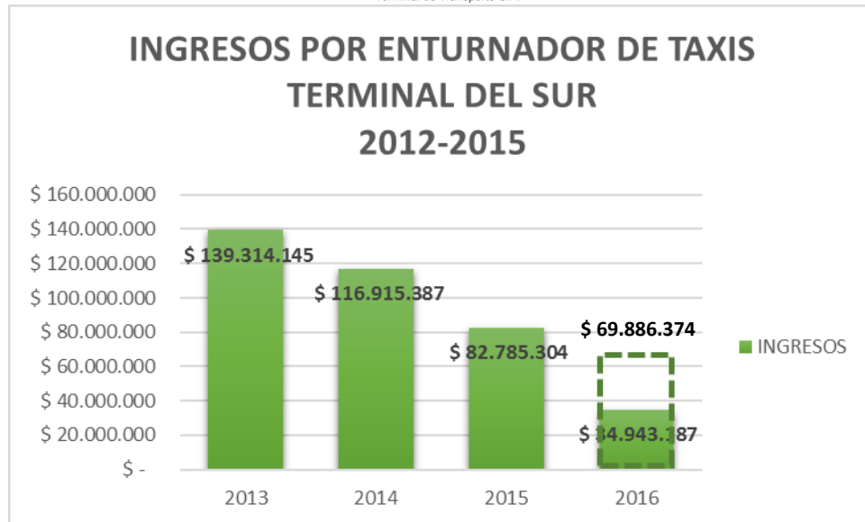
Gráfica No. 3. La Terminal viene disminuyendo considerablemente sus ingresos por este concepto, si comparamos los ingresos de 2013 con las vigencias siguientes el impacto con respecto a 2014 fue de un 16% menos, en 2015 en un 41% y proyectando el segundo semestre de 2016 se llegaría a un 50%.