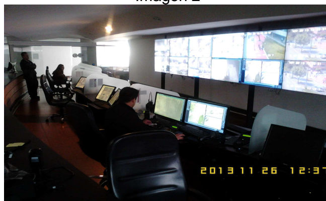
Centro de monitoreo Chapinero