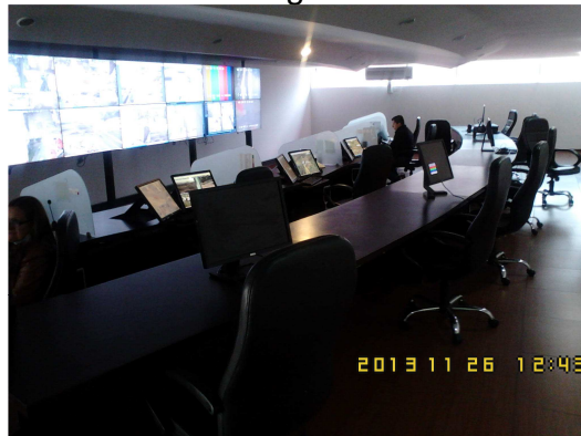
Sala de monitoreo Chapinero

Se pudo corroborar que la empresa VERYTEL, le realiza mantenimiento al sistema de vídeo fronteras en la sala de Chapinero, advirtiendo que este contrato se encuentra suspendido.