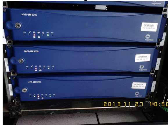
Fuente: centro de monitoreo Germania

El cambio o mal llamada migración de tecnología análoga a digital, no mejora la calidad del video capturado ( ver imagen 4 ) y almacenado, ya que en la actualidad la totalidad de las cámaras que es de 200, son análogas con una resolución en video que va de los 470 líneas a 540 líneas, peor aun cuando se utilizan conversores y traductores de video, que no mejoran la calidad de video, posiblemente se pretenden dar a entender que estas cámaras son digitales cuando se habla de migración o conversión de análogo a digital, si se tiene en cuenta que a la fecha año 2013 su video es análogo, en la actualidad los sistemas de video vigilancia avanzaron de imágenes de 540TVL, a imágenes en full HD o Megapíxeles que van de 5,10 Megapíxeles, a 56 Megapíxeles, lo cual permite una mejor captura y visualización para el análisis de estas imágenes y su utilización en procesos de judicialización y captura de delincuentes.