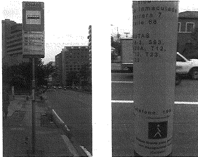
Figura 1. Módulo braille implementado en paradero Zonal