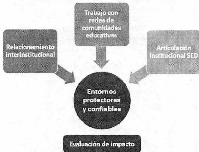
Figura 2. Estrategias Entornos Protectores y Confiables.

Instituciones de educación para el trabajo y el desarrollo humano) que comparten las problemáticas comunes que afectan la convivencia escolar en sus entornos educativos. Por esto, es importante realizar un proceso de análisis sobre las particularidades y características propias de estos territorios, que permitan trazar patrones, recurrencias y dinámicas que den cuenta de las problemáticas que afectan a las comunidades educativas. En este sentido, el componente de Entornos Educativos Protectores se orientará a tres estrategias y a una evaluación de impacto como se observa en la figura 2.