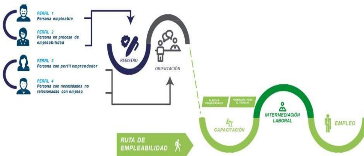
Figura 1. Ruta De Empleabilidad

A través de la Ruta de Empleabilidad de la Agencia de Gestión y Colocación de Empleo del Distrito “Bogotá Trabaja” se implementan las etapas de registro, orientación, formación y preselección y remisión (intermediación laboral), descritas de la siguiente manera: