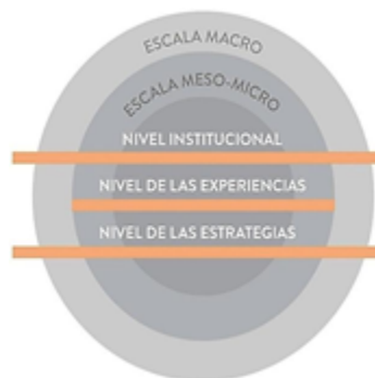
FIGURA 1. Esquema general de la metodología de triangulación múltiple mostrando el cruce de las dos escalas y los tres niveles de análisis.