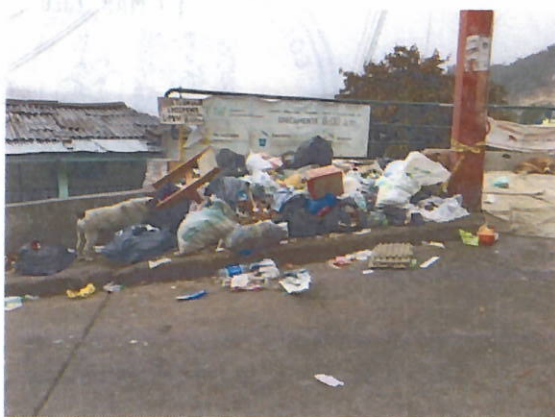
Fotos No. 1. Identificación de puntos críticos

En las siguientes fotografías se puede observar el resultado la implementación del proyecto: