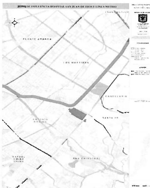
Cuadro no.1 – zona de influencia PEMP

Ahora bien, por ser el PEMP un instrumento de gestión del patrimonio construido de superior jerarquía, donde se establece el área afectada y su zona de Influencia, y en virtud de lo expuesto anteriormente con base en el Artículo 380 Clasificación de los inmuebles en el tratamiento de conservación (artículo 369 del Decreto 619 de 2000) del POT, y en el marco de la Ley 1185 de 2018 base para la expedición de la Resolución que adoptó el PEMP del CHSJDMI, compete al Ministerio de Cultura el pronunciarse sobre la futura intervención de la primera línea del Metro sobre este polígono, y al proyecto de Decreto distrital contener un artículo que establezca dicha articulación.