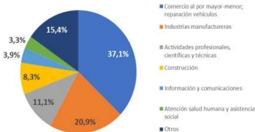
Gráfica No. 2 Boletín Informativo N° 11 Bogotá Responde – junio 30 de 2020