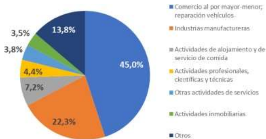
Gráfica No. 1 Boletín Informativo N° 11 Bogotá Responde – junio 30 de 2020