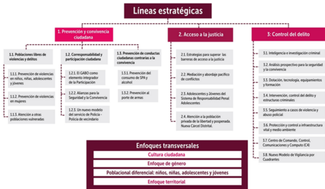
Gráfica 2: Estructura del PISCCJ (2020 - 2024)

Fuente: Elaborado por la Oficina Asesora de Planeación de la Secretaría Distrital de Seguridad, Convivencia y Justicia