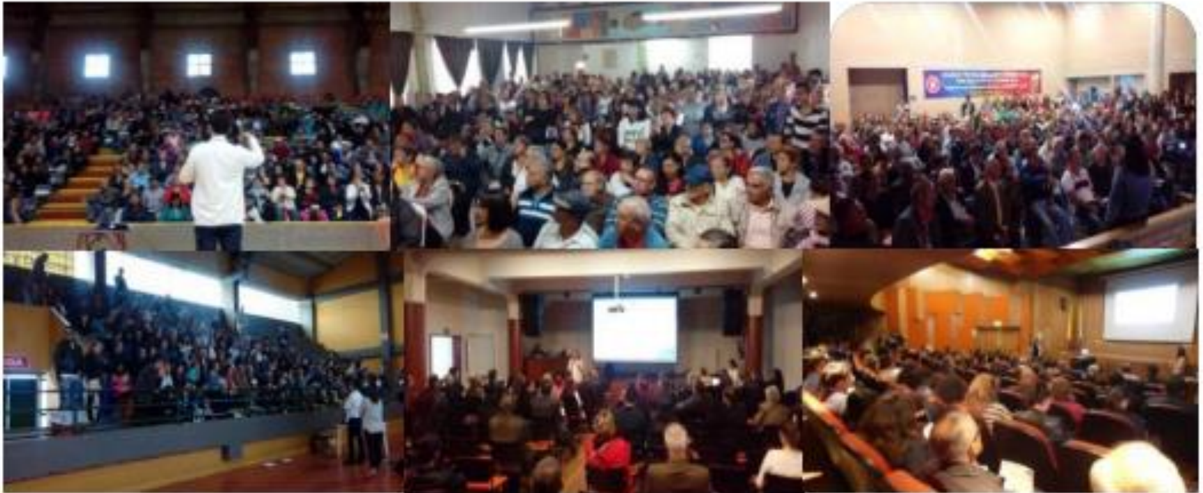
Reuniones de inicio

Programa de información y divulgación a la comunidad: 1) Reunión de inicio (mayo 2017). El trazado fue dividido en seis zonas, atendiendo la vocación residencial, comercial o industrial.