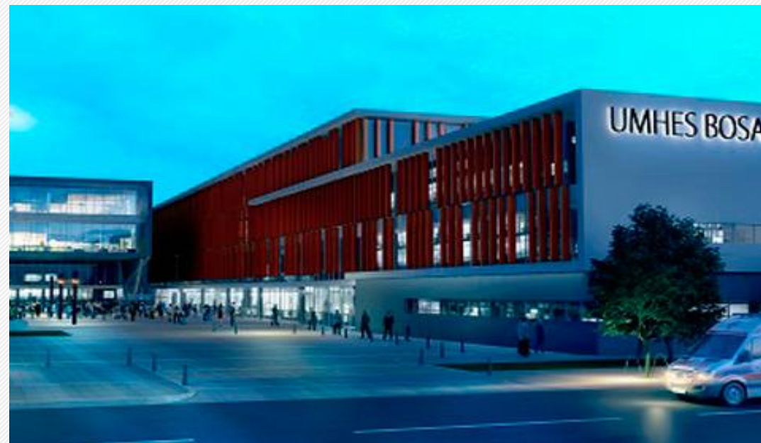
HOSPITAL DE BOSA NIVEL DE ALTA COMPLEJIDAD