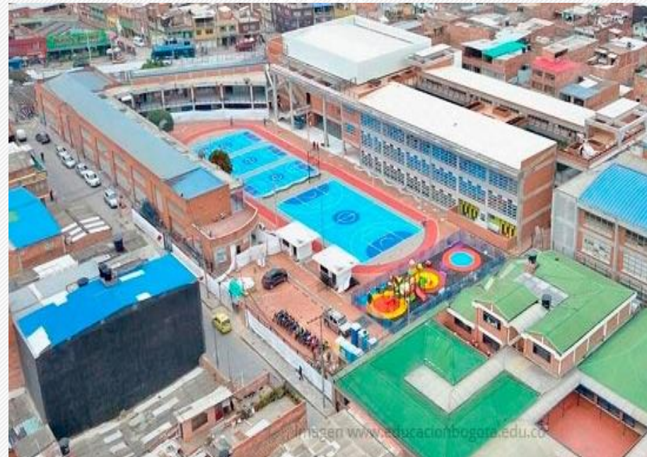
COLEGIO CARLOS ALBÁN