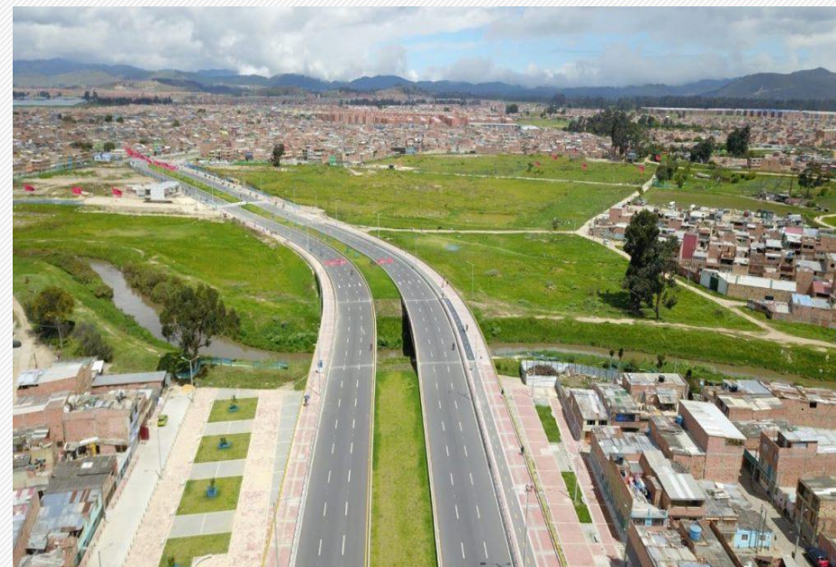
AVENIDA CIUDAD DE CALI