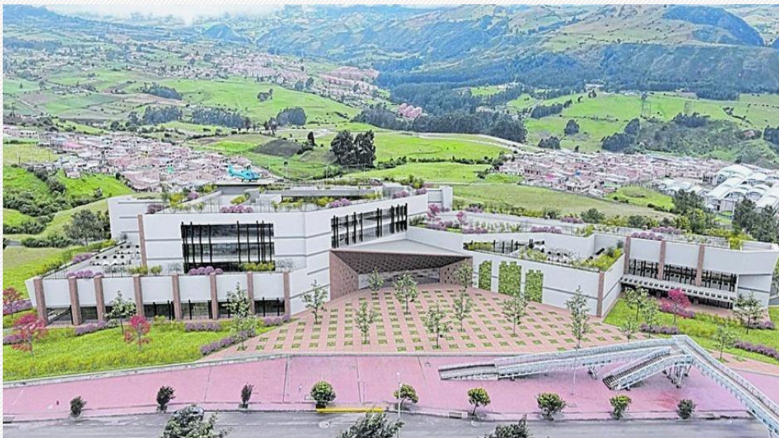
HOSPITAL DE USME