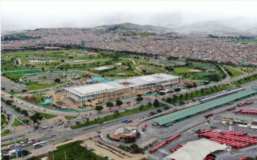
CENTRO DE LA FELICIDAD EL TUNAL