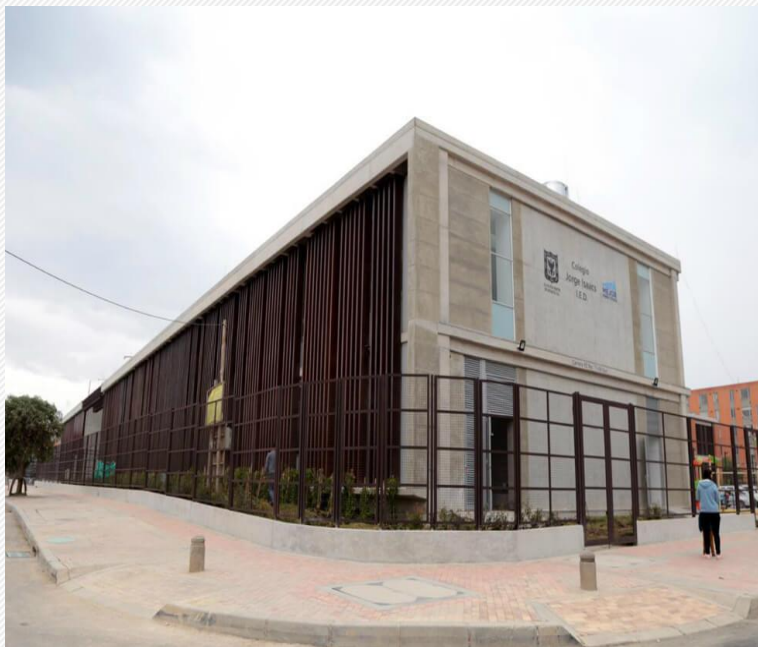
COLEGIO JORGE ISAAC