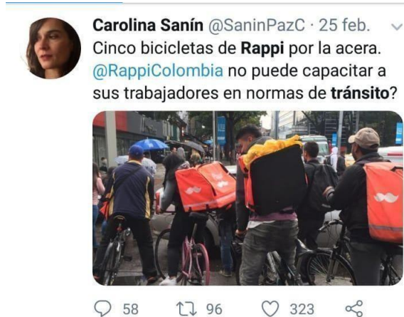
Imagen 4. Tomada de https://twitter.com/SaninPazC/status/1100160701086269445?s=19