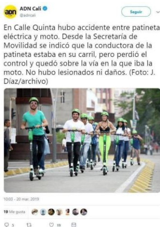
Imagen 6. https://twitter.com/adncali/status/1108413785402994689

4 Tomado de https://www.infobae.com/america/wapo/2018/09/29/los-centros-de-emergencia-advierten-un-aumento-de-accidentes-con-patinetaselectricas/