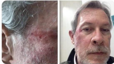
Imagen 3. Tomada de https://twitter.com/NaviaPaz/status/1105621135763406854?s=19