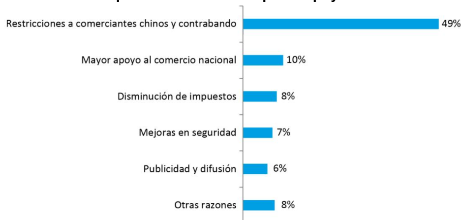
Gráfica 4. Acciones en las que los comerciantes piden apoyo a la Alcaldía de Bogotá D.C.

Fuente: SDDE – DEDE. Censo a establecimientos de comercio del GRAN SAN 20 .