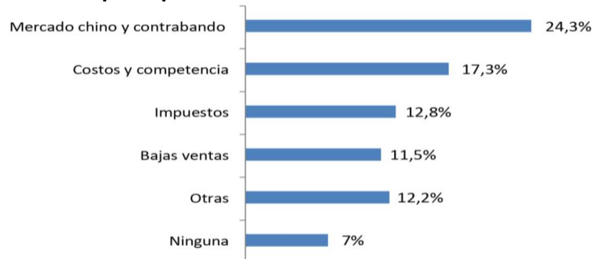
Gráfica 3. Principales problemáticas de los comerciantes del GRAN SAN