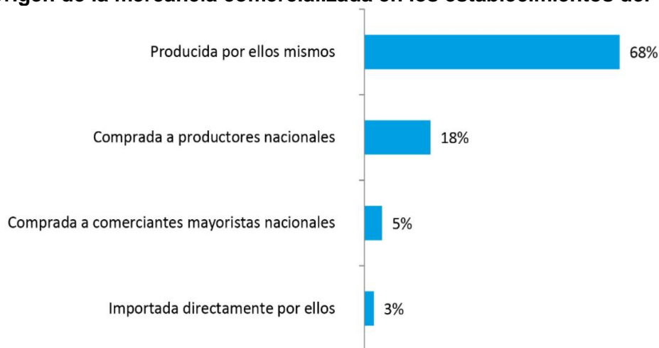
Gráfica 2. Origen de la mercancía comercializada en los establecimientos del GRAN SAN

Fuente: SDDE – DEDE. Censo a establecimientos de comercio del GRAN SAN 18 .