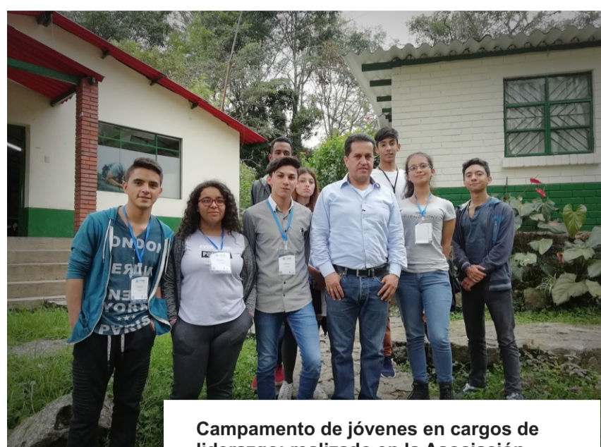
Campamento de jóvenes en cargos de liderazgo: realizado en la Asociación Cristiana de Jóvenes, en Pradilla, Cundinamarca. 20 y el 22 de abril de 2018.