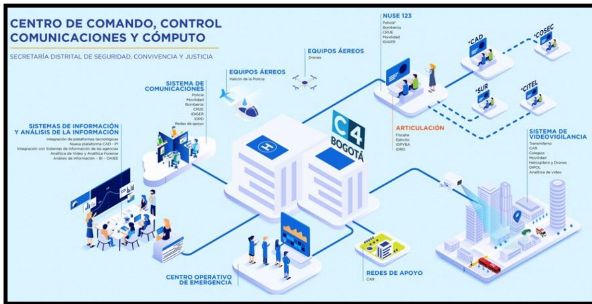
Ilustración 1. Modelo y componentes del C4 en concordancia con el Decreto 510 de 2019

2. Como parte del proceso de integración y articulación se identifica la necesidad de diseñar un nuevo modelo de operación que obedezca a las necesidades de la ciudad y que se ajuste a los requerimientos misionales, operativos, técnicos y legales de cada una de las entidades que hoy conforman el C4. De esta manera se realizan mesas de trabajo con la participación de todas las entidades que hacen parte del C4 y estructura un nuevo modelo de operación interagencias que entre otros incluye una nueva guía de tipificación y nuevos procedimientos.