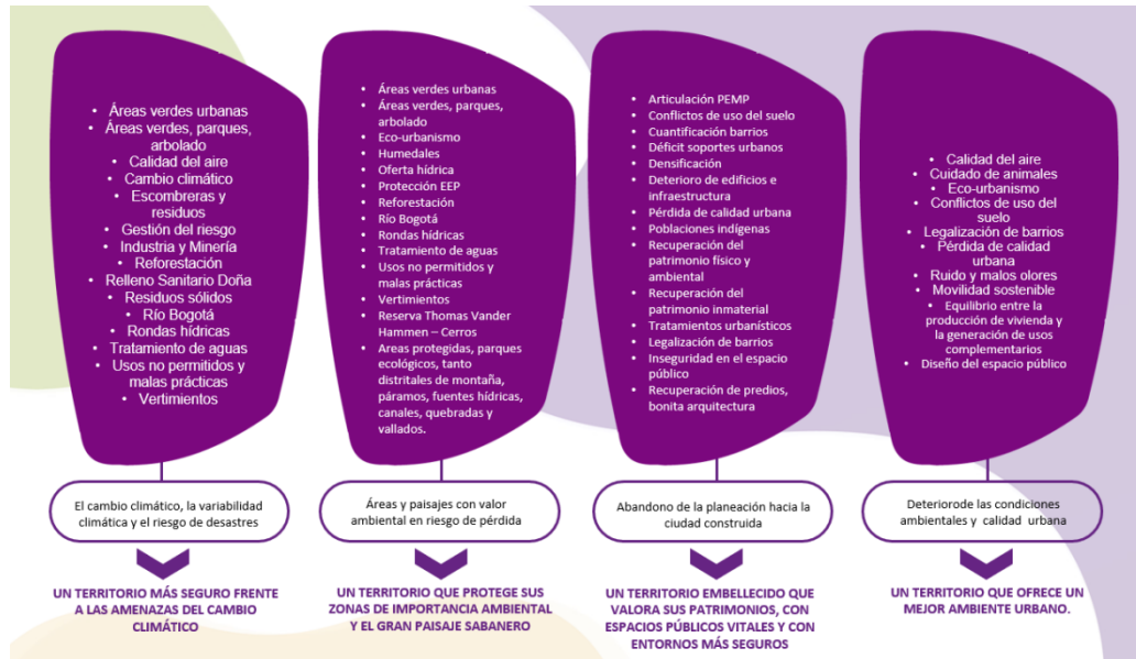
Gráfico 2. Categorías de los objetivos del POT

EVITE ENGAÑOS: Todo trámite ante esta entidad es gratuito, excepto los costos de reproducción de documentos. Verifique su respuesta en la página www.sdp.gov.co link "Estado Trámite". Denuncie en la línea 195 opción 1 cualquier irregularidad.