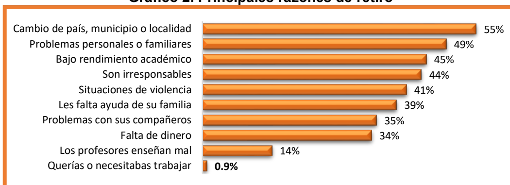
Gráfico 2. Principales razones de retiro