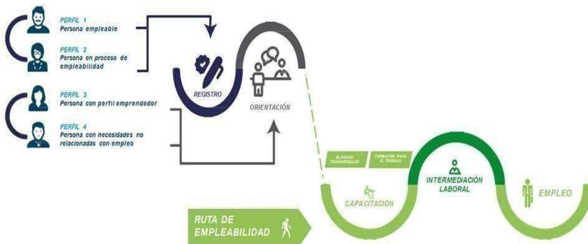
Imagen 2. APED y su Ruta única de empleabilidad de la SDDE

La APED, a través de su ruta de empleabilidad, se dirige a toda la población que busca mejorar su ocupación actual, brindándoles oportunidades laborales de acuerdo con las necesidades del sector productivo, atendiendo criterios de oportunidad y emergencia económica, con orientación ocupacional, formación e intermediación laboral, que es descrita a continuación: