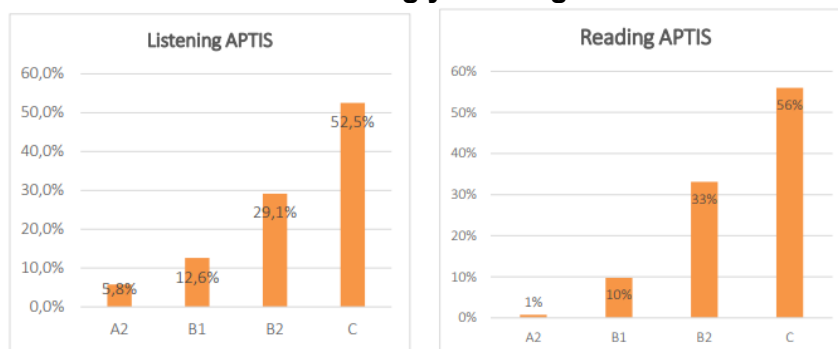
Gráfico 2. Resultados pruebas de nivel de lengua para docentes. Habilidades Listening y Reading