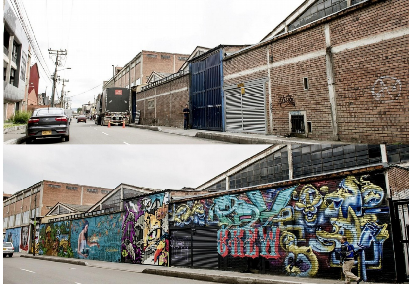
Distrito Graffiti Puente Aranda (2016)

A continuación, se presentan algunas de las fotografías de los impactos positivos obtenidos: