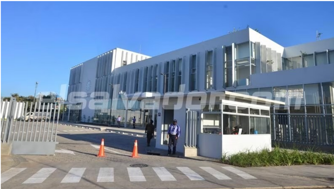
Fachada del Hospital veterinario p blico Chivo Pets en San Salvador.

Este centro especializado p blico brinda un servicio de calidad a la poblaci n, ya que cuenta con todo el equipo necesario y con el recurso humano altamente capacitado, el cual fue elegido mediante un riguroso proceso de selecci n. Este hospital no tiene fines econ micos, ya que no fue creado para lucrarse y todo paciente que entre a las instalaciones recibir  una atenci n oportuna.