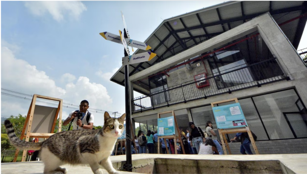
El Centro de Bienestar Animal está ubicado en la Comuna 20, exactamente en la Carrera 56 con Calle 7 oeste. Hay expectativa por inicio de operaciones.

-Otro antecedente que se quiere resaltar es el de la ciudad de Pereira Risaralda , quien con recursos públicos de la ciudad, se convirtió en la primera ciudad del país en implementar un 'Sisbén' para mascotas, (2020) 25 medida orientada a brindarle servicios de atención en salud a perros y gatos de familias de escasos recursos de estratos 1 y 2 registradas en los niveles 0,1 y 2 del Sisben que no tienen la capacidad económica para llevarlos a un veterinario a hacerles vacunación, esterilización, atención en salud entre otros, de manera gratuita.