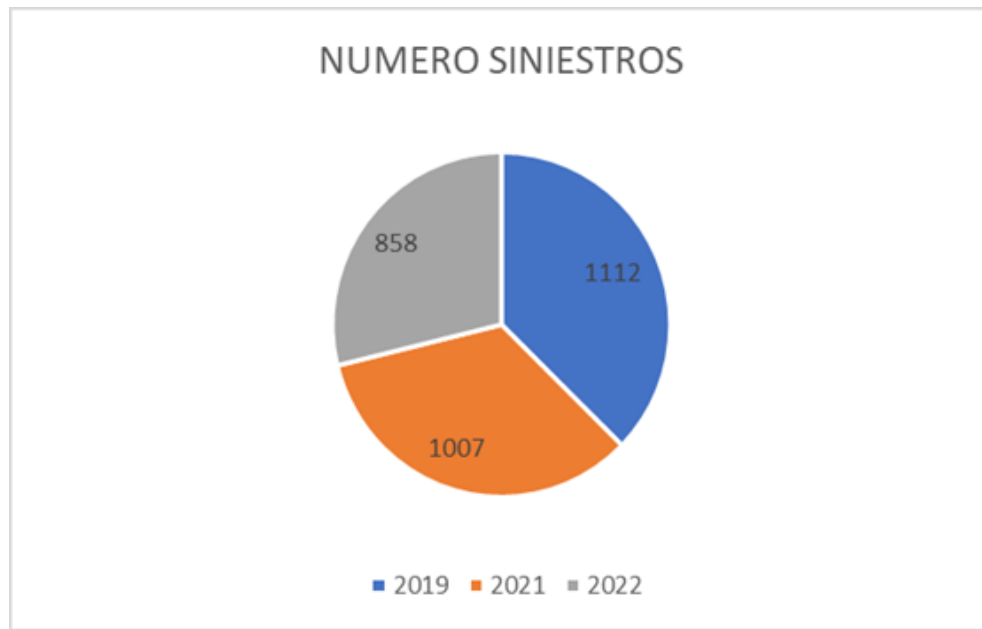
Gráfica No 1. Siniestros por año en zonas de influencia de Cámaras Salvavidas

En la siguiente gráfica se puede observar la totalidad de siniestros para los años 2019, 2021 y 2022 en las zonas e influencia de las cámaras salvavidas.