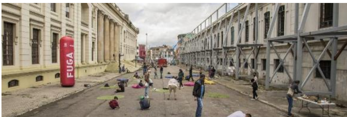
Fotografía. Los espacios de BDC – FUGA.