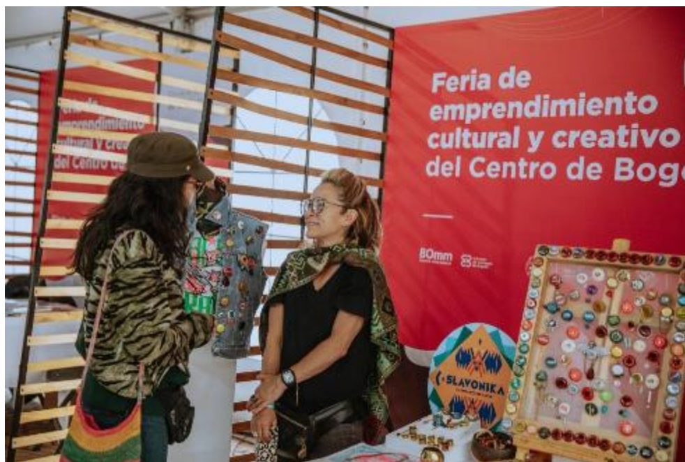
Fotografía. Feria de Emprendimiento BOmm - FUGA

El proyecto busca fortalecer la circulación y encadenamiento para promover y fortalecer a las organizaciones sociales y emprendimientos de la economía cultural y creativa del centro teniendo en cuenta todas las poblaciones y sectores sociales que lo habitan. Por ello, hace parte del Programa 24. Bogotá región emprendedora e innovadora del Plan de Desarrollo , que busca “Priorizar estrategias virtuales que promuevan la comercialización digital, la creación de nuevos modelos de negocio y el desarrollo de soluciones que permitan mitigar el impacto de crisis bajo modelos de innovación; estrategias para reconocer, crear, fortalecer, consolidar y/o posicionar Distritos Creativos; impactar empresas de alto potencial de crecimiento con mayores generadores de empleo, emprendimientos de estilo de vida y PYMES con programas de aceleración, sofisticación e innovación para detonar la generación de empleo en industrias de oportunidad; e implementar el programa distrital de agricultura urbana y periurbana articulado a los mercados campesinos, para la reactivación económica.”