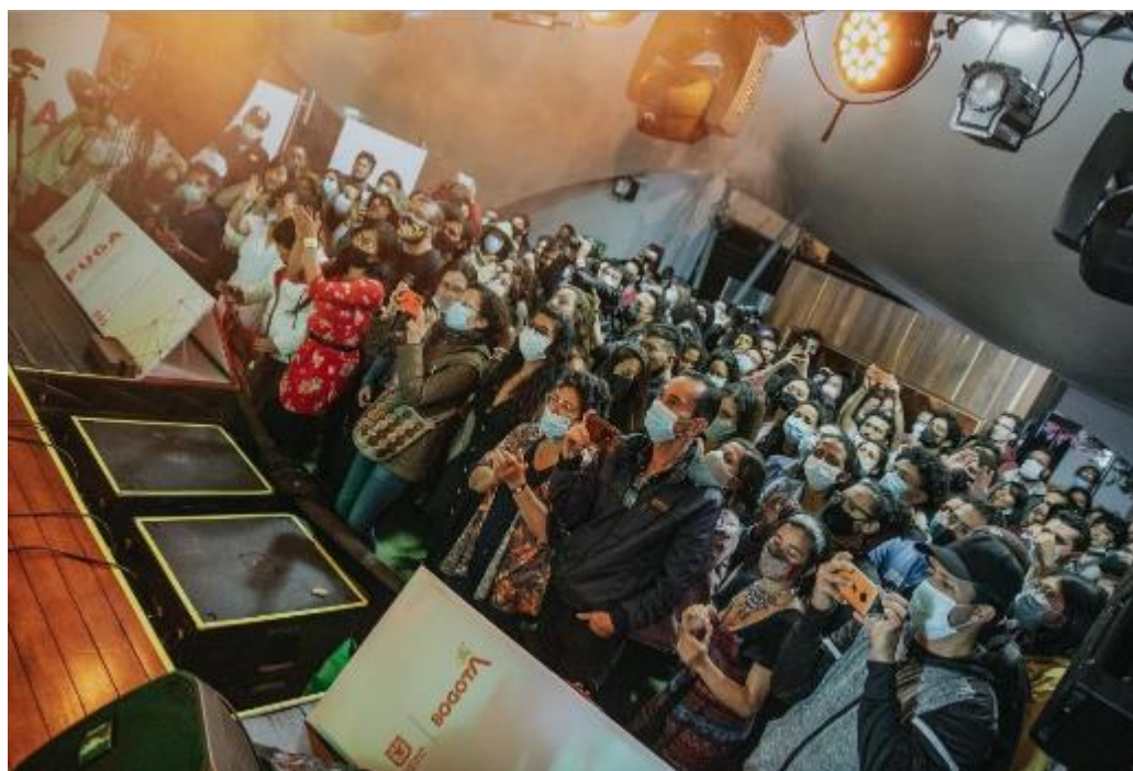
Fotografía. Festival Centro 2022 – FUGA.