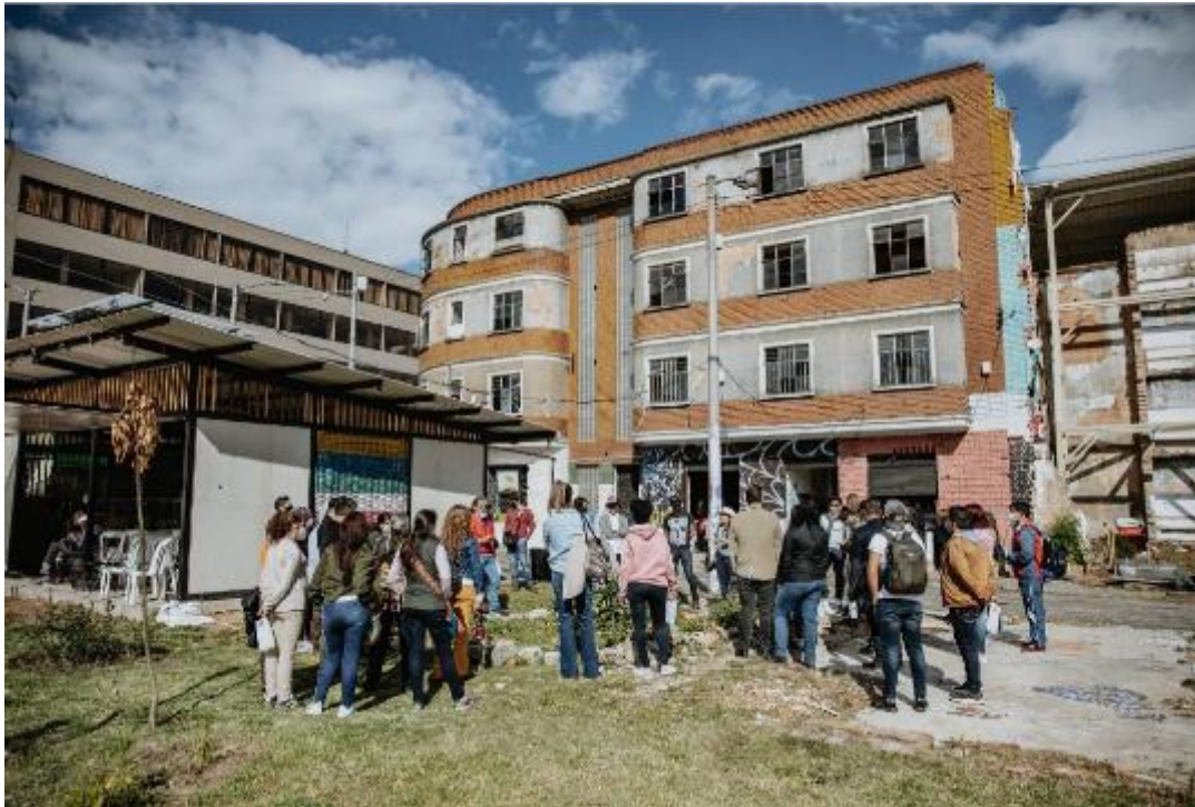
Fotografía. Edificio La Esquina Redonda BDC – FUGA.