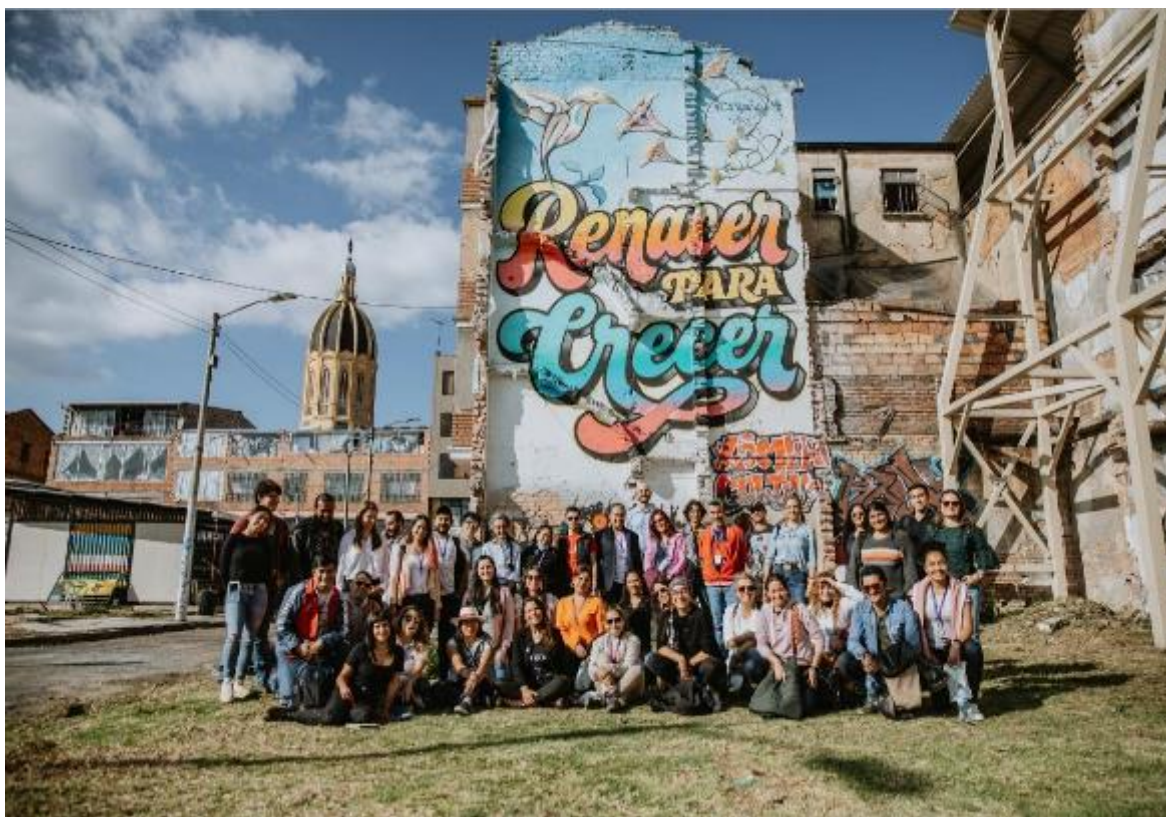
Fotografía. El equipo FUGA en el Herbario BDC 2022 – FUGA.

Este proyecto de inversión se construyó en tiempos de una pandemia mundial ocasionada por un coronavirus denominado Covid 19, que tuvo a la humanidad entera confinada en sus casas y en cuarentena obligatoria para prevenir el contagio, contener el virus y mitigar sus efectos. Por lo tanto, dadas las necesidades identificadas para el adecuado desarrollo institucional, que se evidenciaron de manera importante durante la cuarentena; su formulación propone una nueva visión de la organización y el trabajo, basada en el respeto y el cuidado del medio ambiente; utilizando de manera importante las tecnologías de la información y las comunicaciones; con flexibilidad en los horarios de trabajo combinada con el trabajo remoto y dotación de puestos y espacios de trabajo acordes a las necesidades de la nueva normalidad. Todo esto, sin descuidar los objetivos de una organización cuya misión se fundamenta en promover el arte y la cultura en el Centro de la ciudad, con la responsabilidad desde su quehacer, de repotenciar el centro y reactivar su economía y la de sus actores.