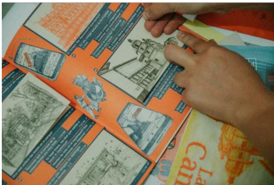
Fotografía. Talleres de Fanzine – FUGA.

ACTIVIDADES PRODUCTO DE ARTICULACIONES: Con el IPES se realizaron 51 intervenciones en 13 plazas de la ciudad. 78 actividades en apoyo a otras entidades como Asosandiego, las Secretarías de Educación, Salud y Cultura, el IDARTES en el Castillo de las Artes, la Universidad Central, Universidad Jorge Tadeo Lozano y la Activación del Parque Santander con otras entidades distritales. 13 actividades en compañía de las alcaldías locales de los Mártires, La Candelaria y Santa Fe.