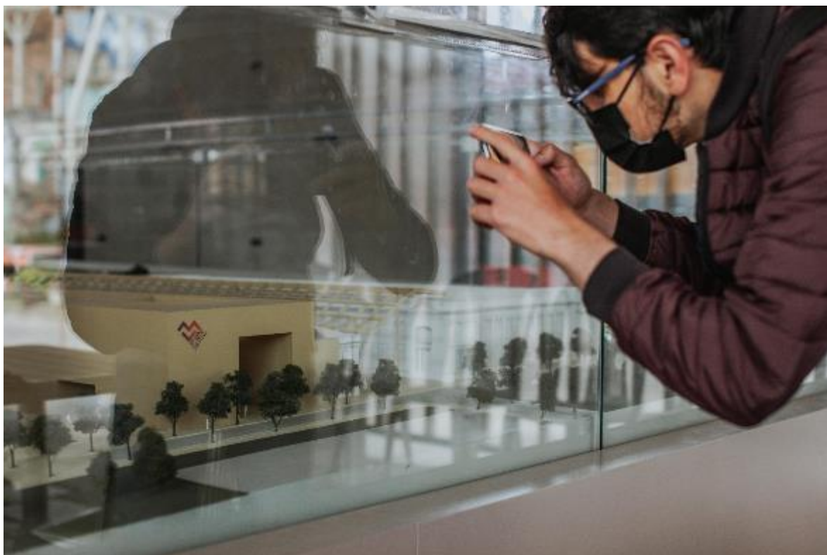
Fotografía: Maqueta del Bronx Distrito Creativo – FUGA.

El presente informe, entrega a la ciudadanía y otros grupos de interés, los resultados de la gestión institucional y la ejecución de los recursos públicos administrados por la entidad en la vigencia 2022 en el marco del Plan de Desarrollo “Un Nuevo Contrato Social y Ambiental para la Bogotá del Siglo XXI”.