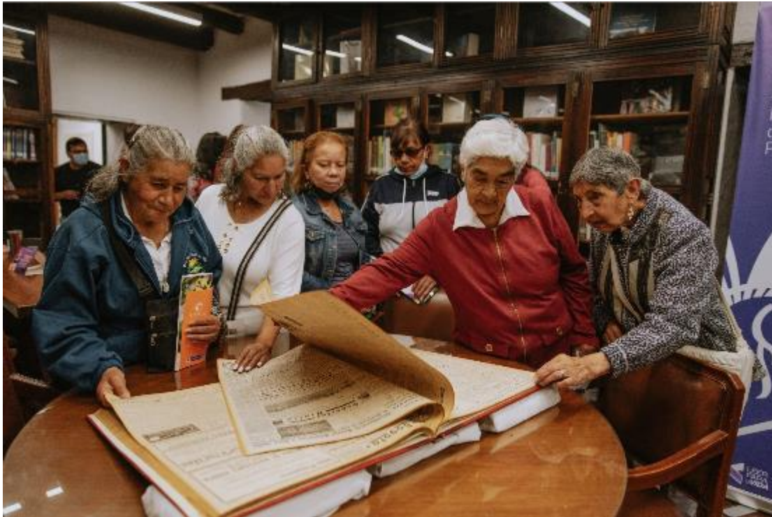
Fotografía. Inauguración Biblioteca Pública FUGA – FUGA.