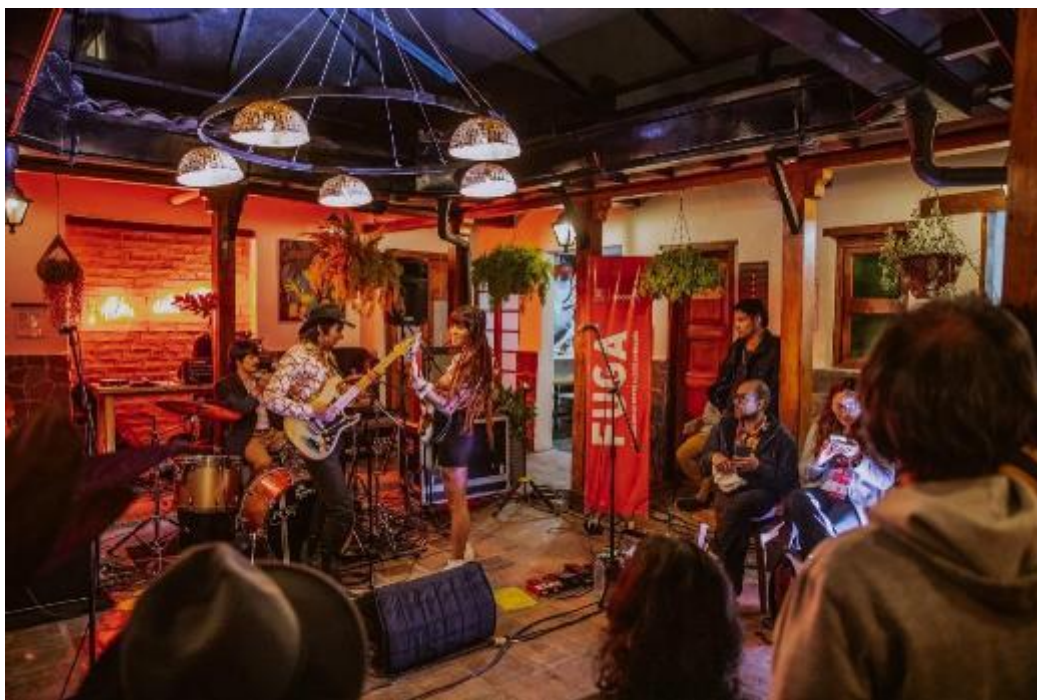
Fotografía. Show case BOMM - FUGA.