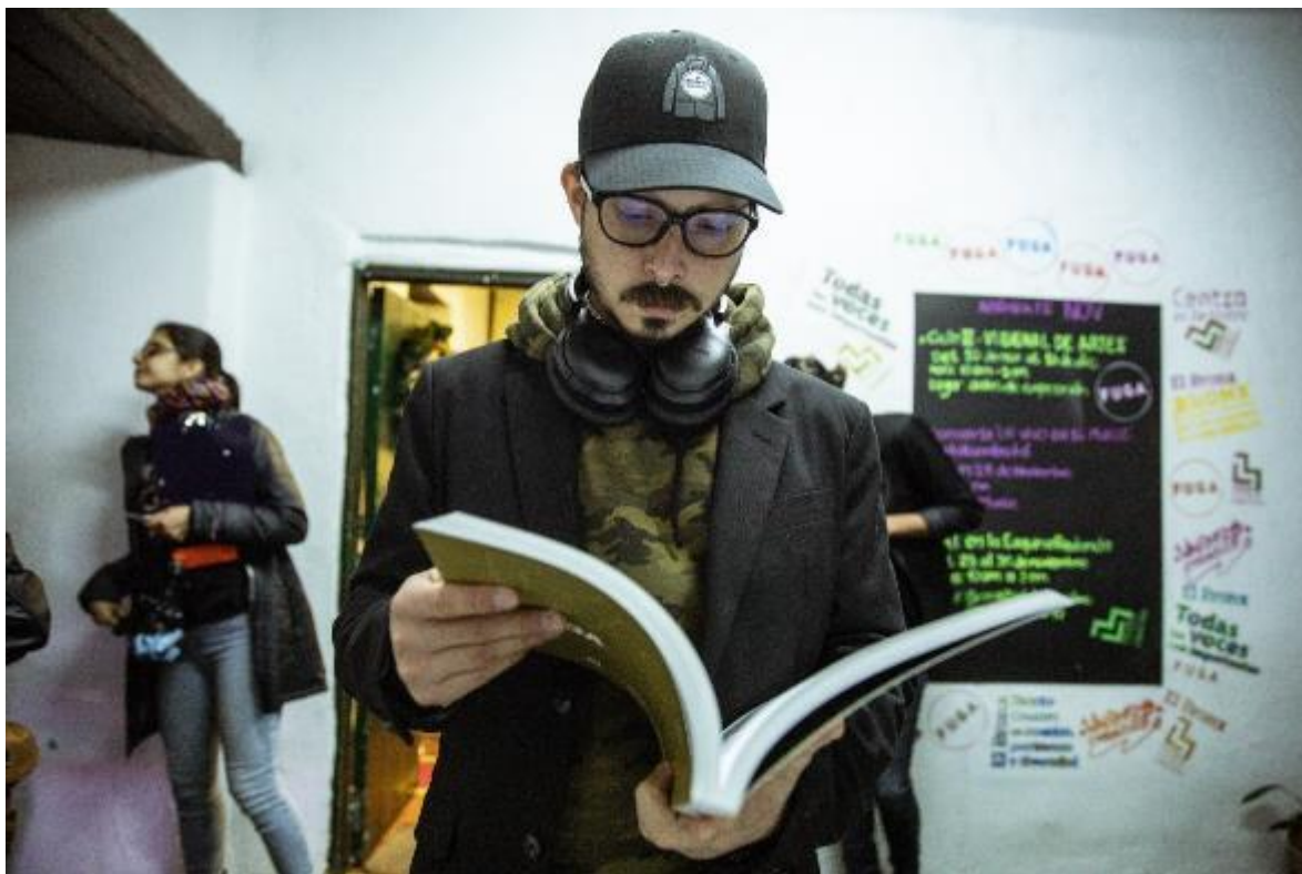
Fotografía. Libro 50 Años de la FUGA – FUGA.

La Subdirección de Gestión Corporativa se encarga de dar soporte a la misionalidad de la FUGA, a través de la planeación, las políticas y los lineamientos institucionales en materia administrativa, para propender por que los objetivos de la entidad se puedan realizar de manera eficiente, efectiva y eficaz.