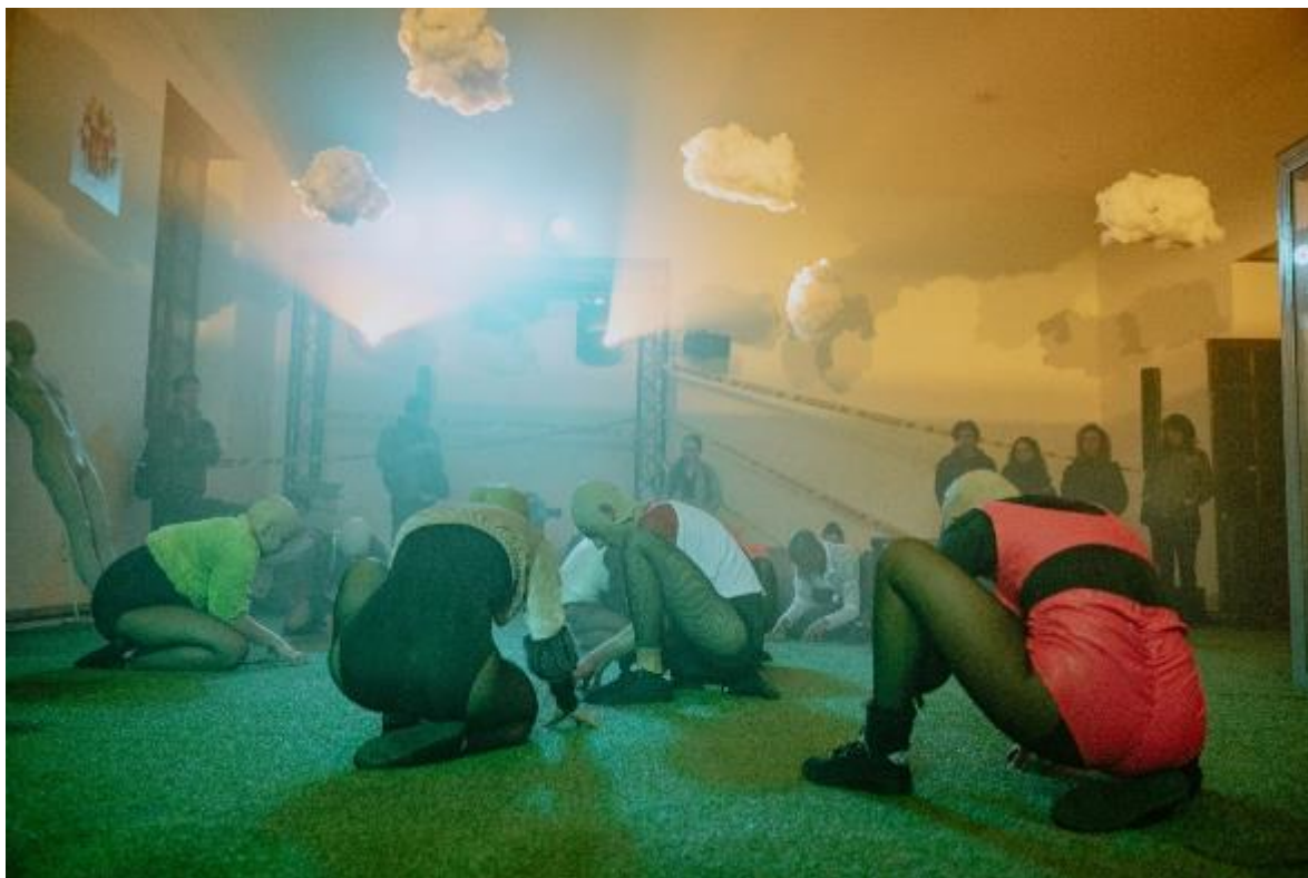
Fotografía: Elysium Danza Contemporánea - Bronx Distrito Creativo – FUGA.

La Subdirección para la Gestión del Centro de Bogotá tiene como objetivo la revitalización del centro de Bogotá, a partir de los lineamientos de la política pública de economía cultural y creativa y de la articulación con actores públicos y privados para la puesta en marcha de proyectos e iniciativas que contribuyan a transformar las relaciones de la comunidad con el centro de la ciudad; a construir mecanismos de cultura ciudadana y al desarrollo del ecosistema cultural y creativo de las localidades de Los Mártires, La Candelaria y Santa Fe, de acuerdo con sus particularidades, la oferta de bienes y servicios culturales y creativos, y sus retos.