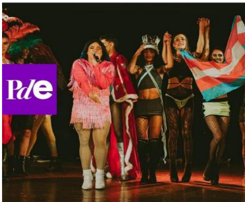
Fotografía. Ganadoras Programa Distrital de Estímulos 2022 – FUGA.