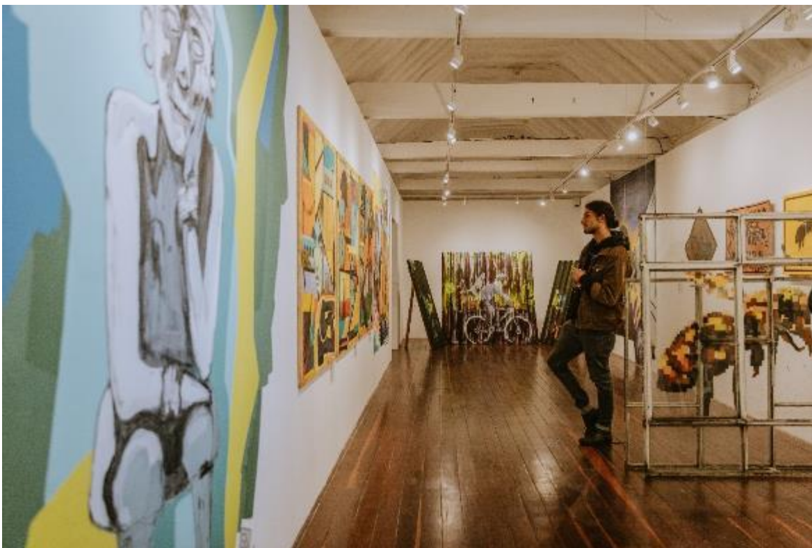
Fotografía. Primer Ciclo VI Bienal de Arte – FUGA.