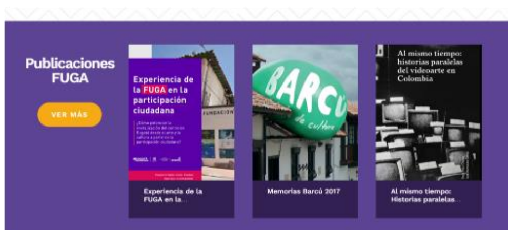
Ilustración. Publicaciones – FUGA.