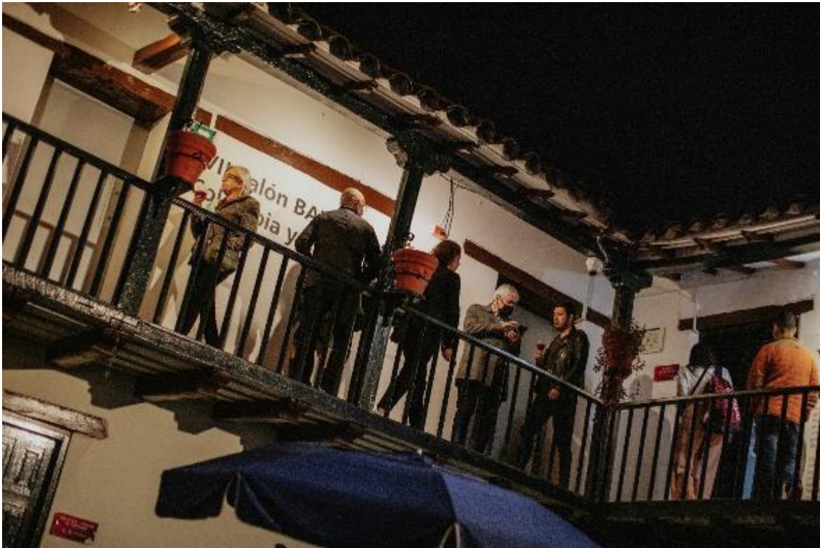
Fotografía: Salas de Exposición – FUGA.