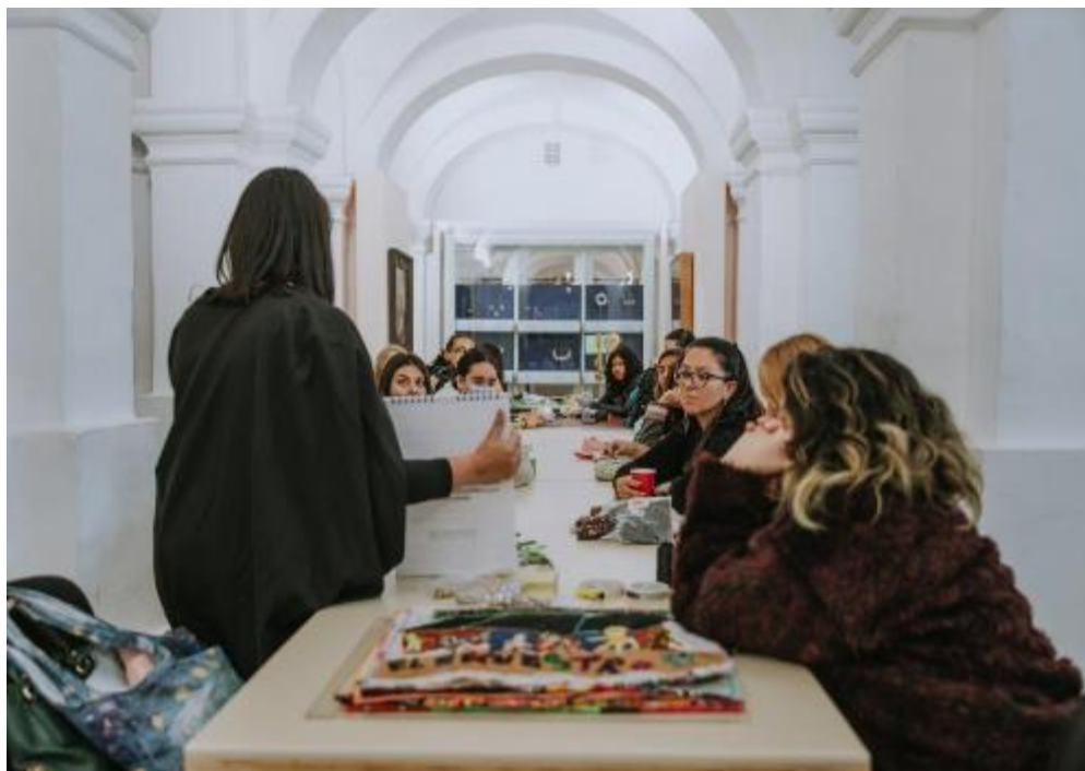
Fotografía. Taller Moda con Historia 2022 - FUGA

Adicionalmente, se realizaron los procesos de intercambio de saberes con los ganadores del Premio a la Gestión cultural y Creativa del Centro de Bogotá y las acciones de formación con diferentes grupos étnicos de la ciudad.