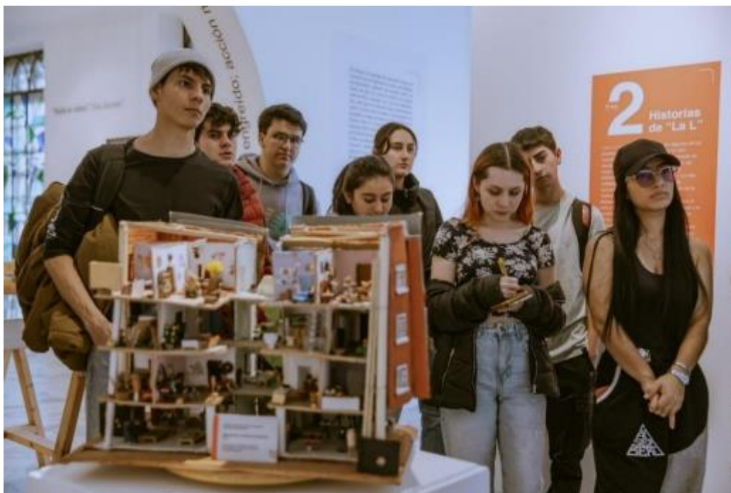
Fotografía. Exposición Esquina Redonda - FUGA

A continuación, se presenta el balance de cumplimiento de las metas del proyecto de inversión 7664- Transformación Cultural de imaginarios del Centro de Bogotá con corte a 31 de diciembre: