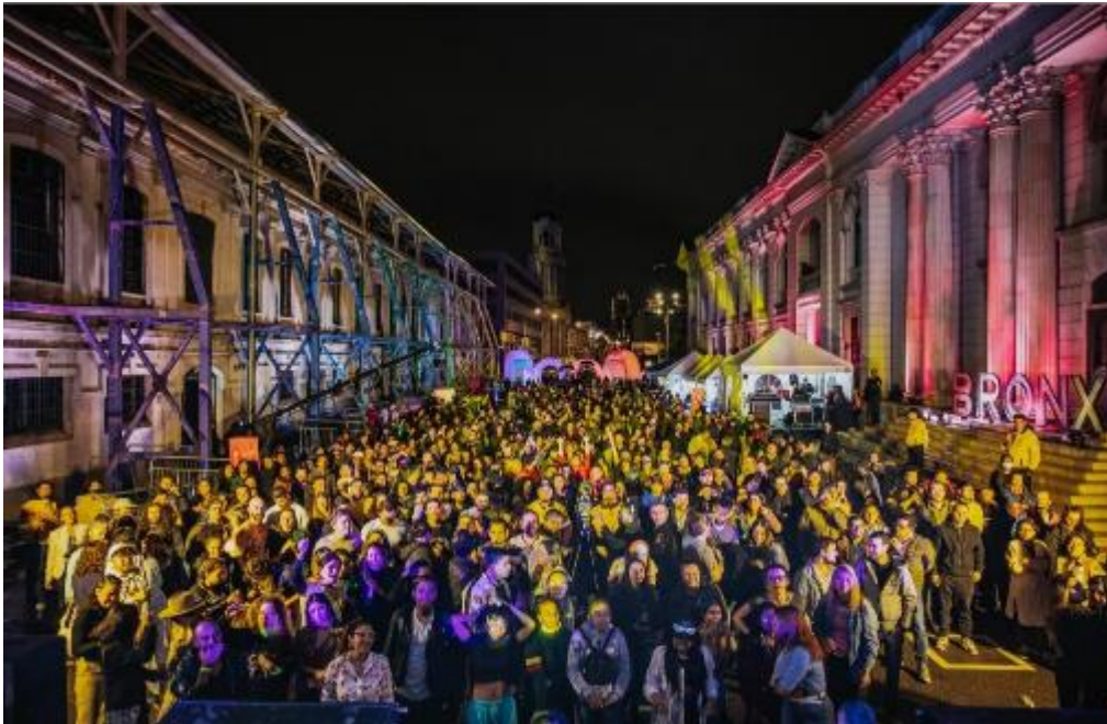
Fotografía. Vamo' a Champetea' – BDC. FUGA.

El Plan de Desarrollo actual estableció en su Artículo 146, lo siguiente: “Resignificación del Centro. Para la resignificación y valoración del centro de Bogotá como responsabilidad de todos los sectores y asunto prioritario, se promoverá, en el marco del POT, la formulación e implementación de instrumentos normativos, de política pública, de ordenamiento territorial y modelos de colaboración público-privada necesarios para que el Centro sea el escenario de este contrato de igualdad de oportunidades para todos los ciudadanos y ciudadanas.”