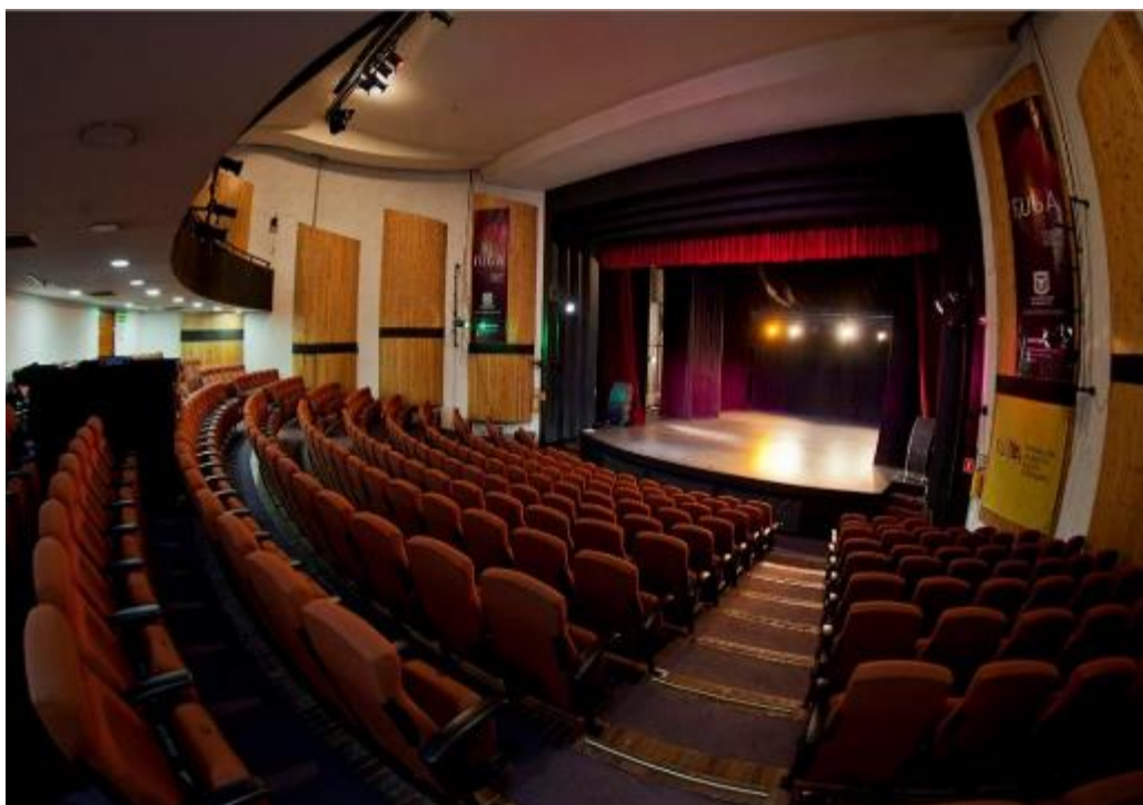
Fotografía. Auditorio en reforzamiento - FUGA

Para la FUGA es muy importante contar con unos equipamientos culturales aptos que le permitan desarrollar y ejercer su misionalidad, que cumplan con la normatividad vigente y que estén en óptimas condiciones. Para ello, este proyecto busca garantizar la seguridad, el acceso, la comodidad, el goce y el disfrute por parte de los usuarios, los visitantes y los funcionarios; además de cumplir con las condiciones mínimas para la circulación y exhibición de las obras de arte, los productos artísticos y la oferta cultural y artística de la entidad.