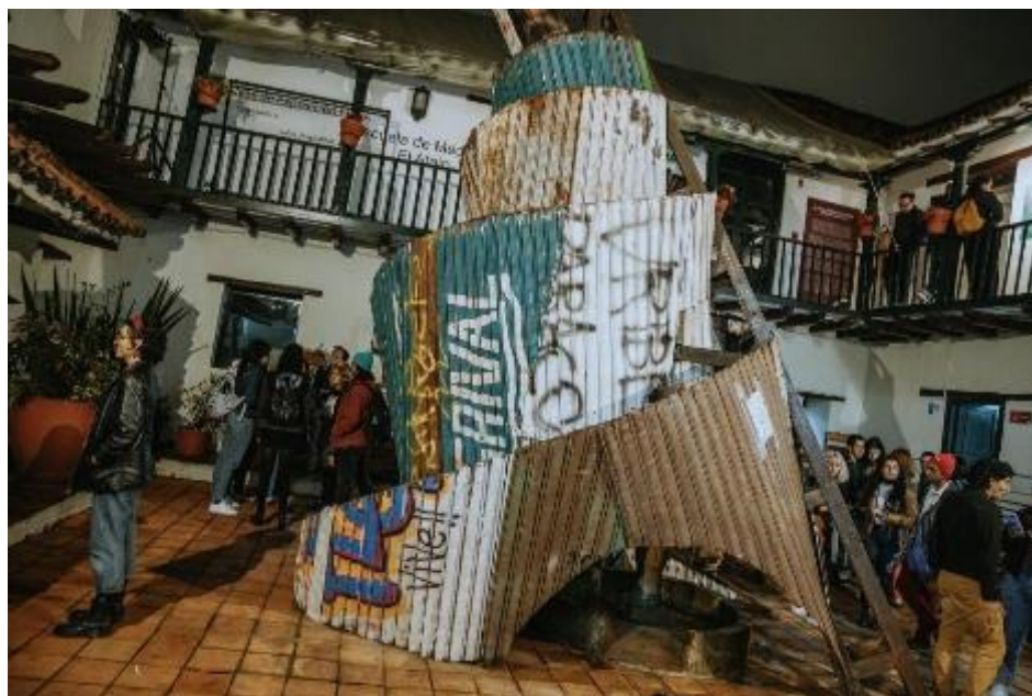
Fotografía. II Ciclo VI Bienal de Artes Plásticas y Visuales 2022 – FUGA.