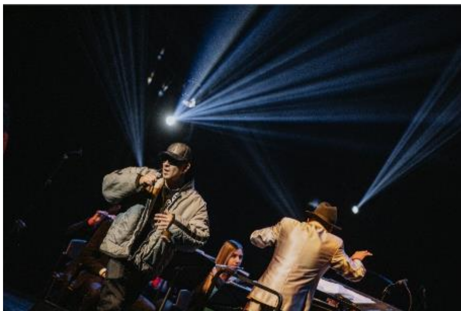
Fotografía. Rap Filarmónico - Creación BDC

Durante 2022 se desarrollaron 104 actividades en el marco de las diversas alianzas y articulaciones, con una asistencia de 8.485 personas.