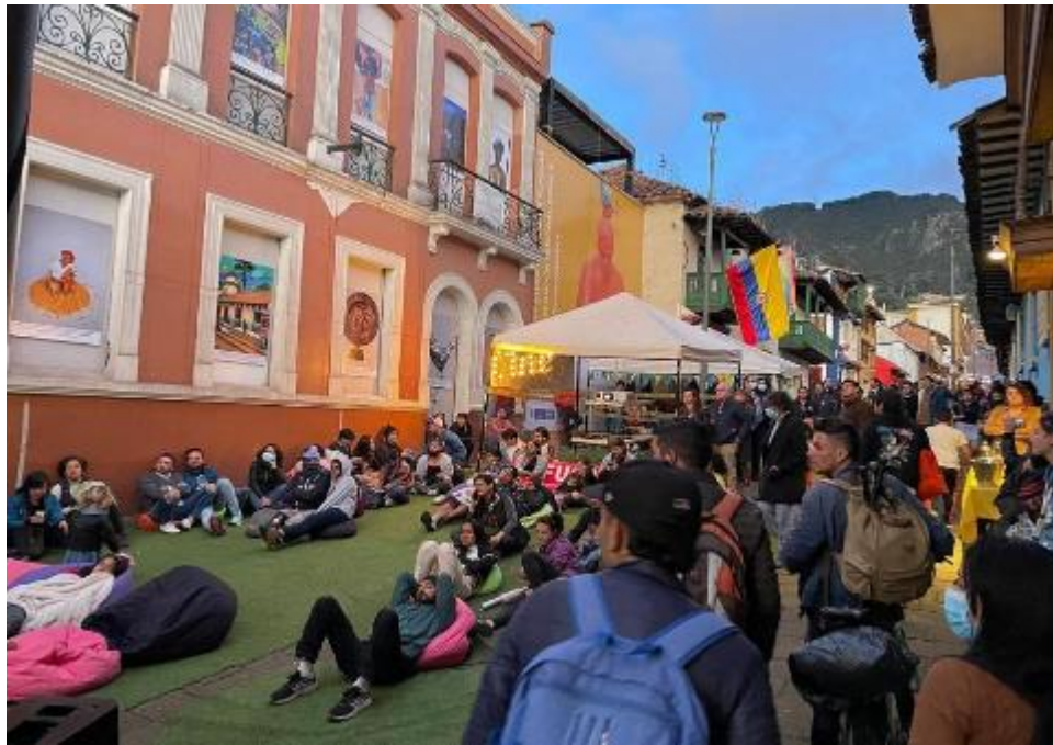
Fotografía. Proyección Cine Calle 10 – FUGA.