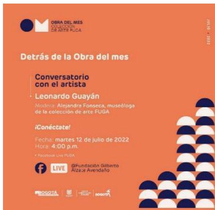
Ilustración. Conversatorio- Obra del mes – FUGA.

No obstante, se presentaron retrasos con ocasión de la dificultad en la consecución de cotizaciones para los estudios de mercado, lo que ocasionó la necesidad de replantear los procesos y actualizar los cronogramas.