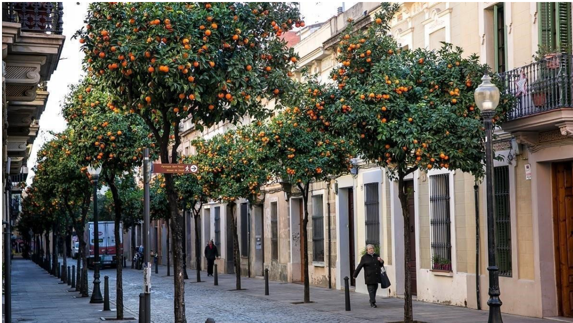
Foto: El carrer Coroleu, con los naranjos en plena efervescencia. JOAN CORTADELLAS 18