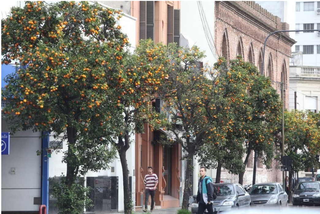
Foto: Frutales en el casco urbano 20