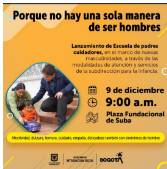
Ilustración 1. Invitación Lanzamiento Escuela de Padres cuidadores.2021

Por otro lado, la Secretaría Distrital de Integración Social informa en comunicación escrita del 24 de marzo 2023, que durante el año 2022 desde el Proyecto de Inversión 7744 se adelantó la construcción del documento para el lineamiento Escuela de padres cuidadores y masculinidades alternativas implementadas en el marco de la atención en Jardines Infantiles y Casas de pensamiento Intercultural. El objetivo de la Escuela es presentar una alternativa de solución a los altos índices de violencia perpetrados por los hombres en un rango de edad entre los 17 y 59 años, en contra de las mujeres de su entorno, a través de procesos de educación con la finalidad de disminuir acciones violentas y cambiar los imaginarios y paradigmas violentos que le han sido asignados culturalmente a los hombres, mediante procesos de sensibilización y socialización, en articulación con las entidades distritales y locales.