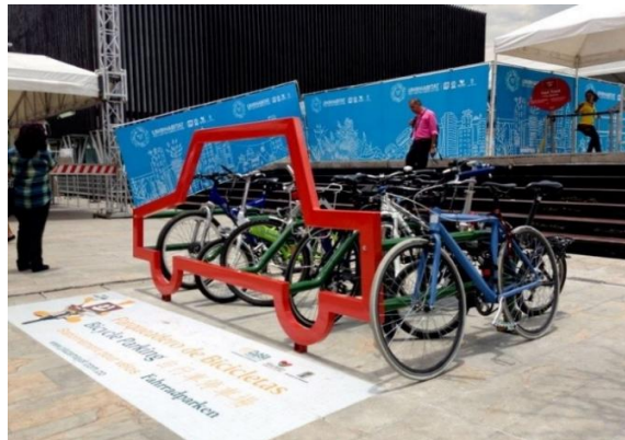
Imagen de cicloparqueaderos en Foro Urbano Mundial, Medellín, 2014

“EQUIDAD URBANA EN EL DESARROLLO - CIUDADES PARA LA VIDA”, asistieron cerca de 22.000 personas.