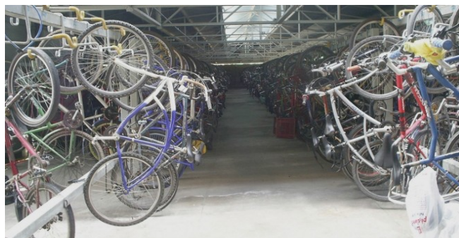
Imagen de cicloparqueadero Ascobike en Muau, Brasil.