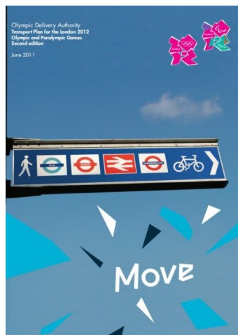
Portada de documento Plan de Transporte Londres 2022

Se esperaba que unos 300.000 espectadores fueran en bicicleta y caminando a las sedes de los Juegos en Londres.