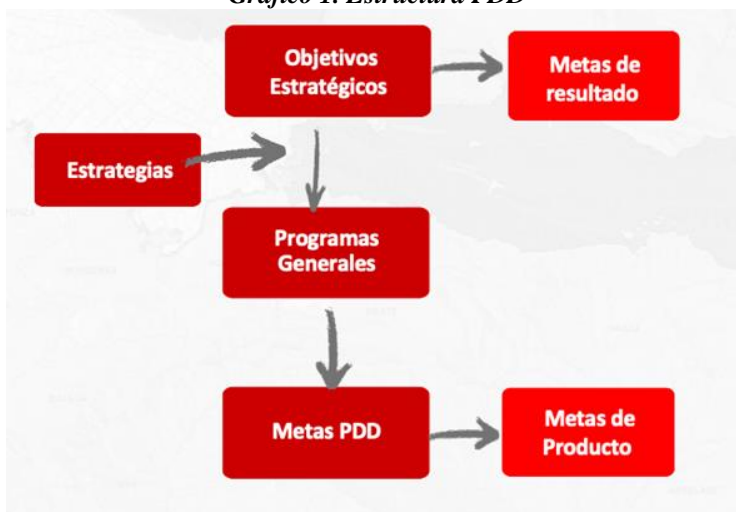
Gráfico 1. Estructura PDD

Artículo 6. La estructura del Plan Distrital de Desarrollo. La estructura del Plan Distrital de Desarrollo 2024-2027 “Bogotá camina segura”, en adelante el Plan Distrital de Desarrollo, se concreta gráficamente así: