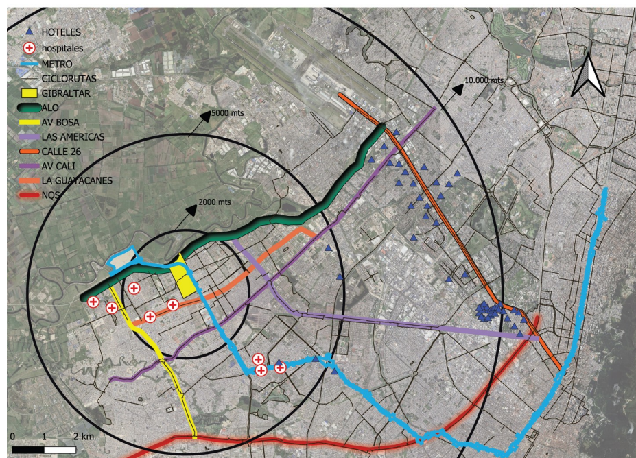
Figura 2 Red vial del sector vs Propuesta hotelera Fuente: IDRD- base de datos IDECA

RESPUESTA: Actualmente, teniendo en cuenta la infraestructura vial con que cuenta el Distrito Capital en el sector donde se desarrollará el proyecto Gibraltar, para llegar desde la zona hotelera de la calle 26, se proyecta tomar la Av. Cali en sentido sur y hasta la calle 12, en sentido occidental, para tomar la Av. Guayacanes, tomando un tiempo de traslado promedio de 30 minutos.