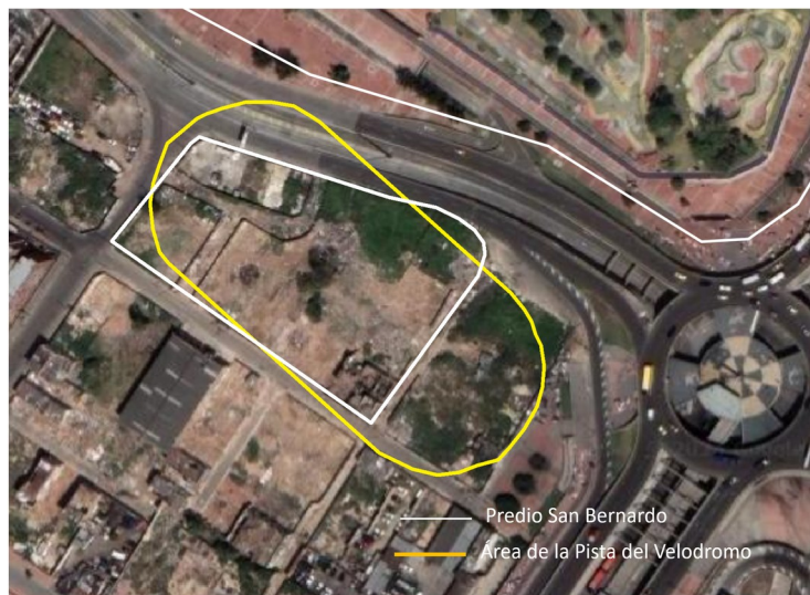
Predios IDRD vs huella de pista del Velódromo

De acuerdo con estos parámetros y servicios adiciones se dispone a revisar la huella de la pista en los predios denominados San Bernardo como se presenta a continuación: