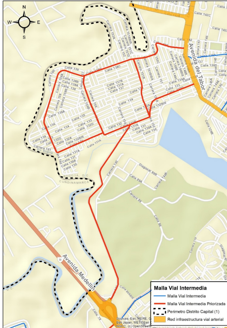
Cinturón verde Lisboa y Conexión Lisboa y Calle 80

El trazado de malla vial arterial contenido en el Mapa CU-4.4.3 “SISTEMA DE MOVILIDAD – ESPACIO PÚBLICO PARA LA MOVILIDAD RED VIAL” del Decreto 555 de 2021, no contempla el trazado de vías de la malla vial arterial, atravesando el Humedal Juan Amarillo. No obstante, tal como se enunció en numerales anteriores, se precisa que la elaboración los proyectos de intervención y construcción de la malla vial arterial es competencia del Sector Movilidad de la Administración.