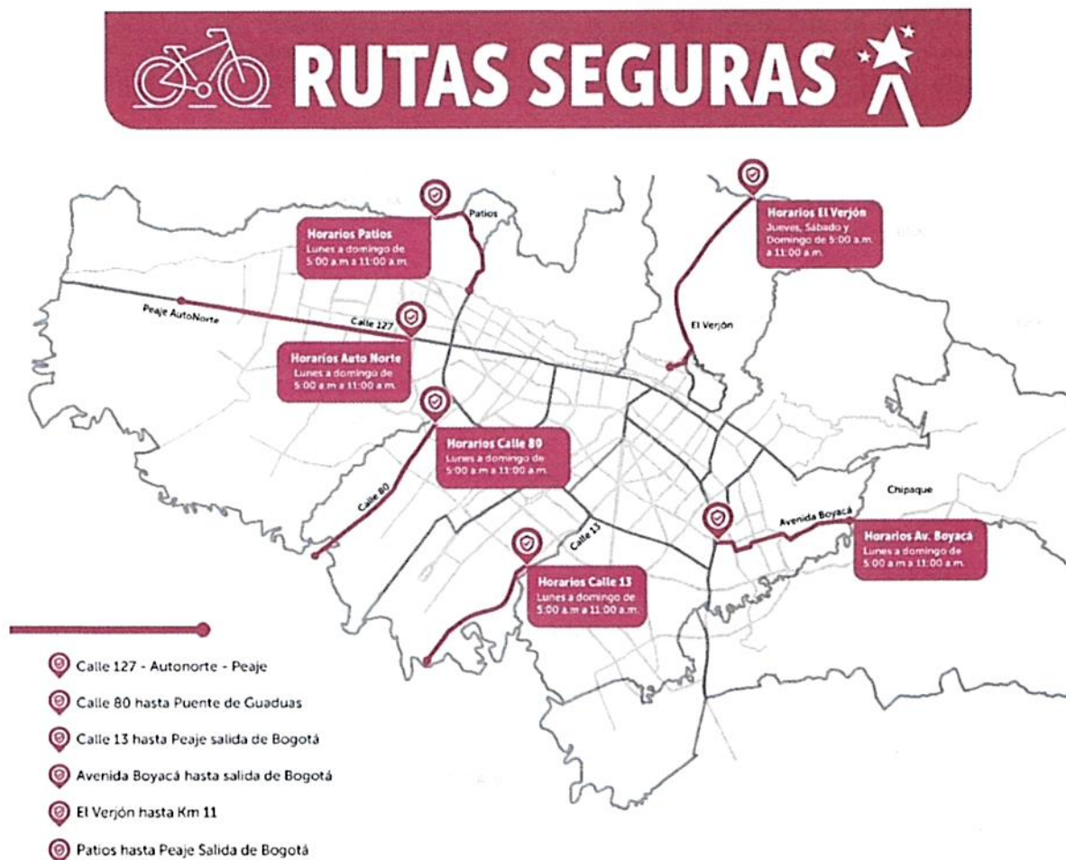
Mapa 1. Rutas Seguras

A su vez, dichas rutas se presentan en el mapa 1: