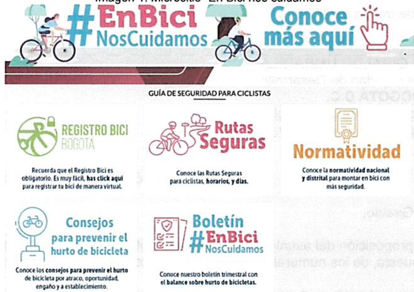
Imagen 1. Micrositio "En Bici nos cuidamos"