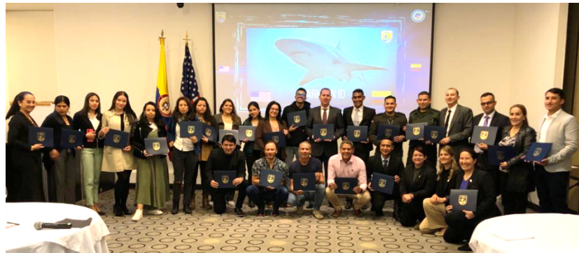
Fotografía 1. Taller reconocimiento y uso de aplicaciones de identificación de partes de tiburón (abril/2023).

De igual manera, en el 2023 apoyó al Servicio de Pesca y Vida Silvestre de los Estados Unidos (U.S. Fish and Wildlife Service), en la organización de un taller para el reconocimiento y uso de aplicaciones de identificación de partes de tiburón con especialistas del continente (Fotografía 1), en el cual también participó para capacitar a parte de su equipo técnico.