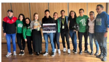
Secretaría Distrital de Movilidad Segundo puesto