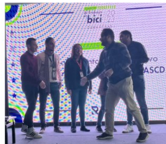
Departamento Administrativo del Servicio Civil Distrital DASCD Tercer puesto