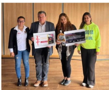
Unidad Administrativa Especial de Catastro Distrital UAEC Primer Puesto