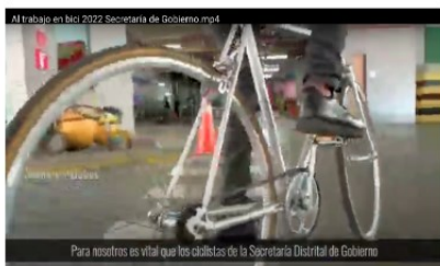
Secretaría Distrital de Gobierno Primer Puesto