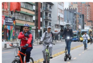
Alcaldía Local de Usme Segundo Puesto