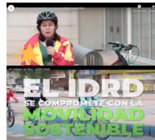
Instituto Distrital de Recreación y Deporte (IDRD) Tercer Puesto