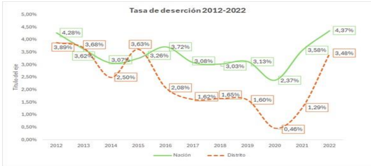
Gráfica 1. Tasa de deserción 2012-2022*

De igual forma, si se compara con otras ciudades con contextos demográficos y sociales similares como Medellín y Cali, estas ubicaron sus tasas de deserción por encima de los resultados de la ciudad y el país en 4,91% y 5% respectivamente.