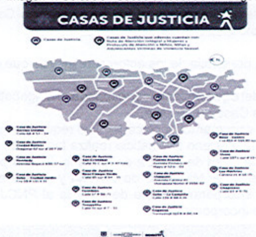
Imagen 1. Ubicación Casas de Justicia en Bogotá.