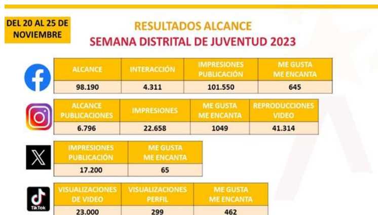
Gráfico 1. Resultados Alcance Semana Distrital de Juventud