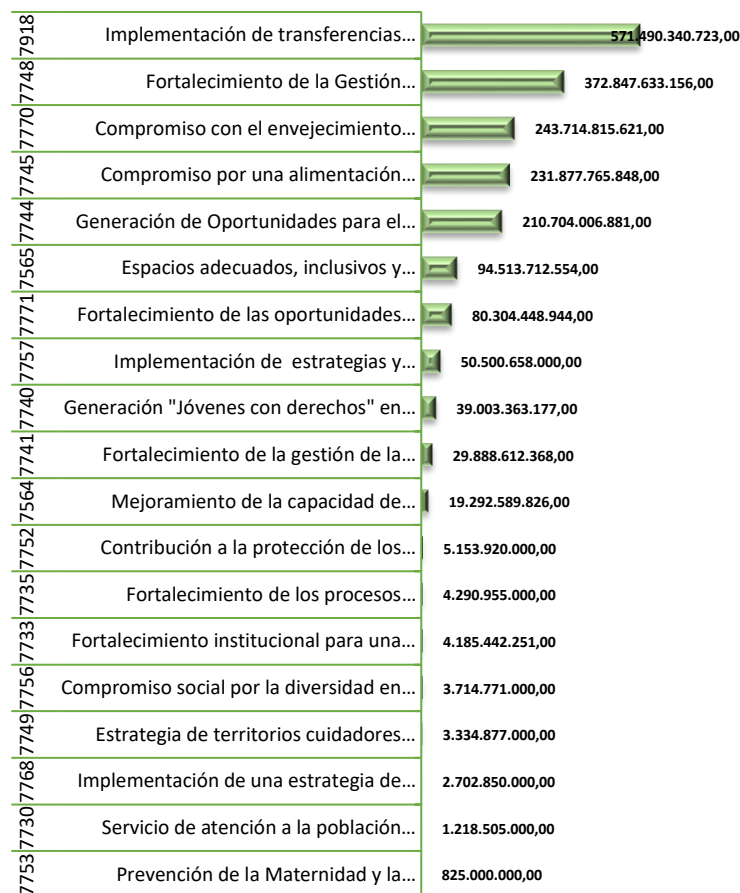
Gráfica 1 Presupuesto final proyectos de inversión 2023