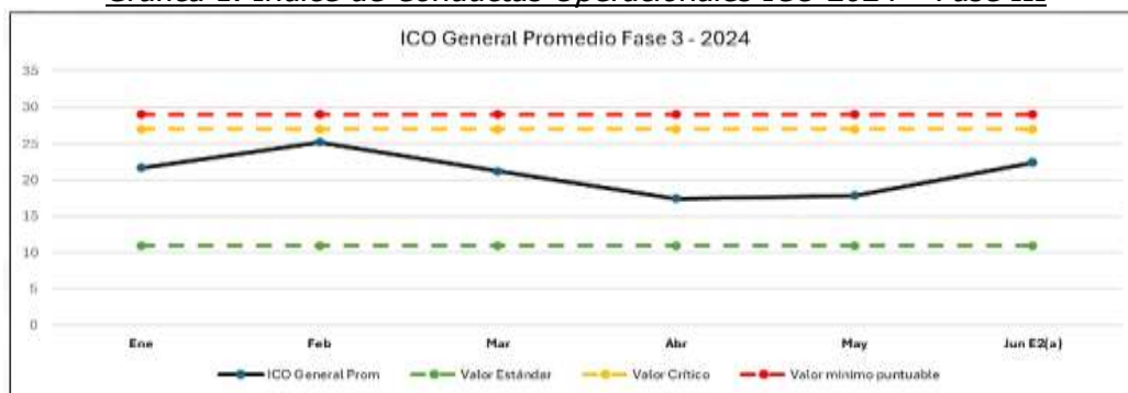
Grafica 1. Índice de Conductas Operacionales ICO 2024 – Fase III

Los valores de referencia para el Índice de Conducta Operacional (ICO) según la Circular Nro. 035 de 2020, aplicables para la Fase 3, establece que el indicador debe ser menor o igual a 11 para cumplir con el valor estándar, mientras que el valor crítico se establece en 27. Durante la etapa de consolidación, el valor mínimo puntuable se sitúa en 29. Estos valores son fundamentales para evaluar y asegurar la calidad del servicio prestado por los operadores (conductores) del SITP.