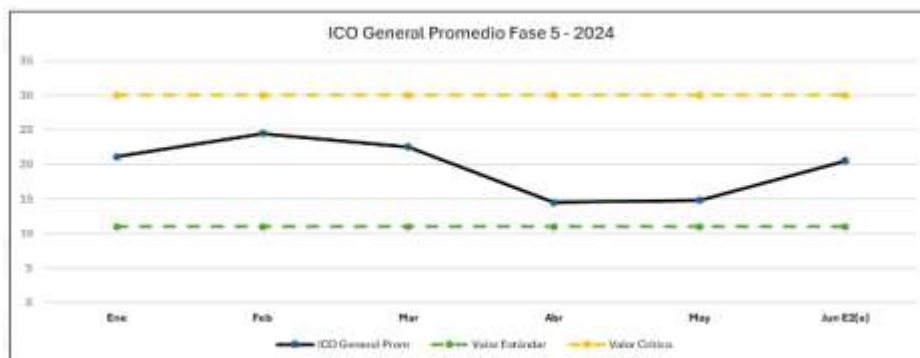
Grafica 2. Índice de Conductas Operacionales ICO 2024 – Fase V

Con relación a la gráfica anterior y relacionada a la información del componente Fase III; se puede observar que durante lo corrido del año 2024, se ha logrado mantener un ICO promedio dentro de los rangos establecidos para un valor crítico. Siendo el pico más alto en el mes de febrero con un ICO general del 25,19. Contrastando el valor logrado en abril el cual fue el valor más bajo durante todo el periodo de análisis con un ICO del 17,43.