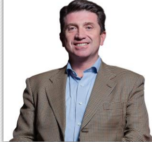
Diego Molano Aponte