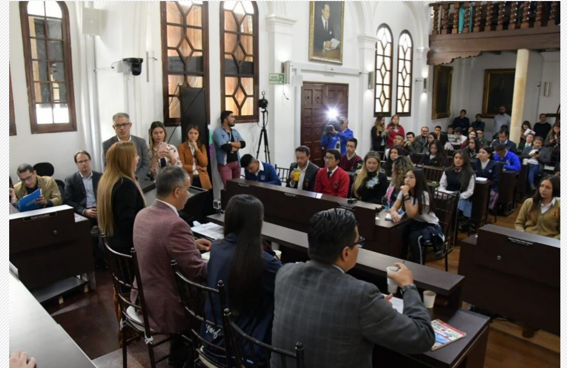
Día del Cabildante Estudiantil