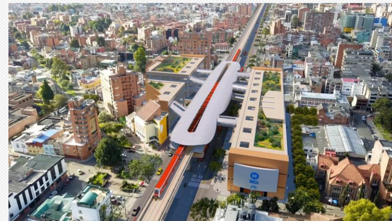
Estado del Proyecto Primera Línea del Metro de Bogotá