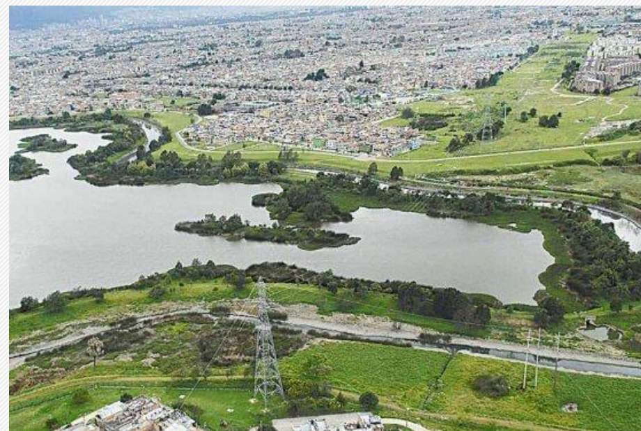
Intervención en el Humedal Tibabuyes Sesiones ordinarias mes de mayo