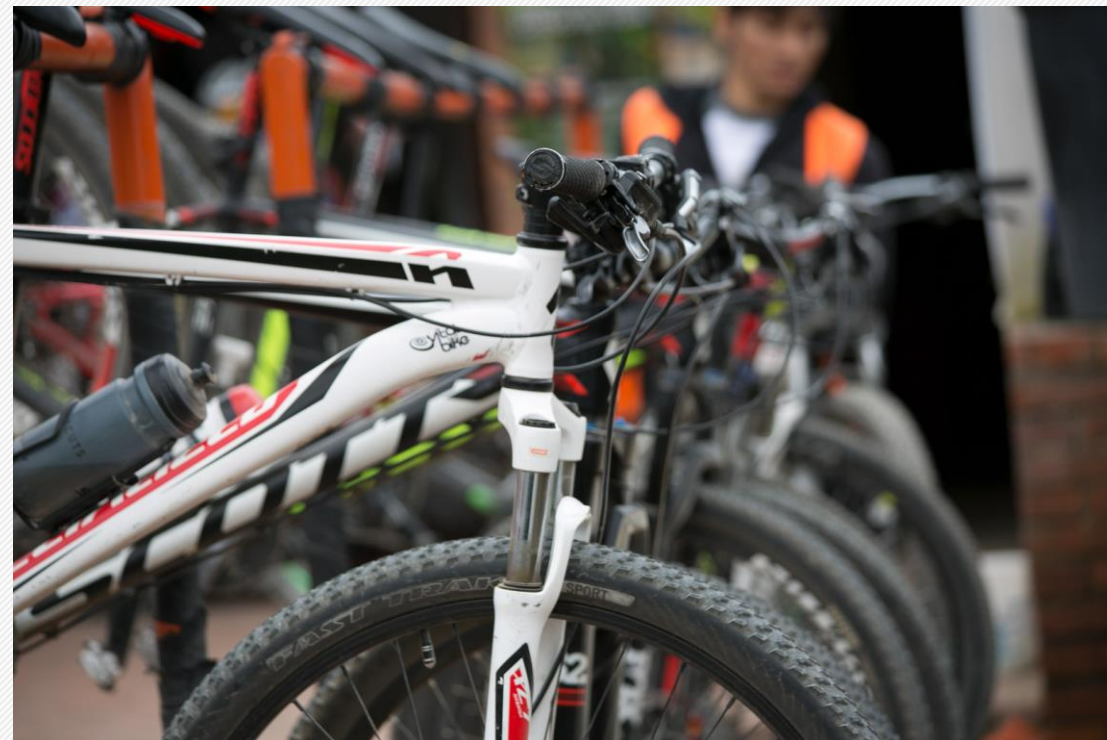
Programa Al Trabajo en Bici

Trabajamos en el mejoramiento del bienestar y clima laboral de todos los funcionarios de la Corporación