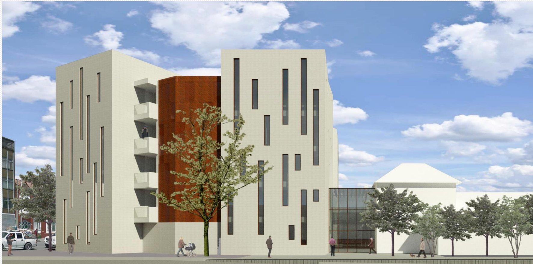
Nuevo Edificio del Concejo de Bogotá