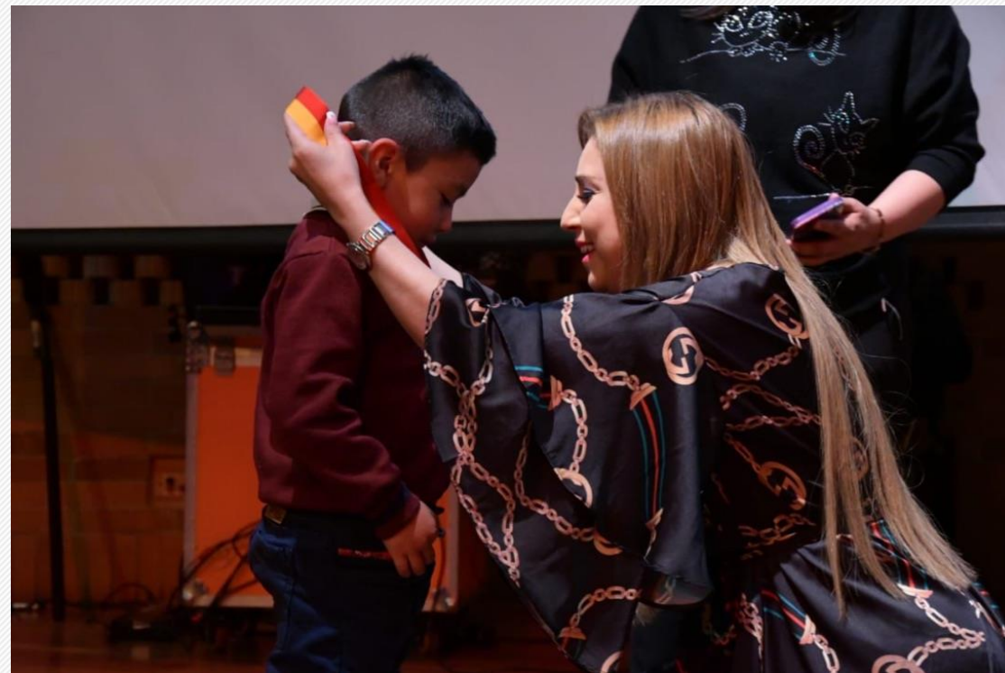
Merito Literario Don Quijote de la Mancha