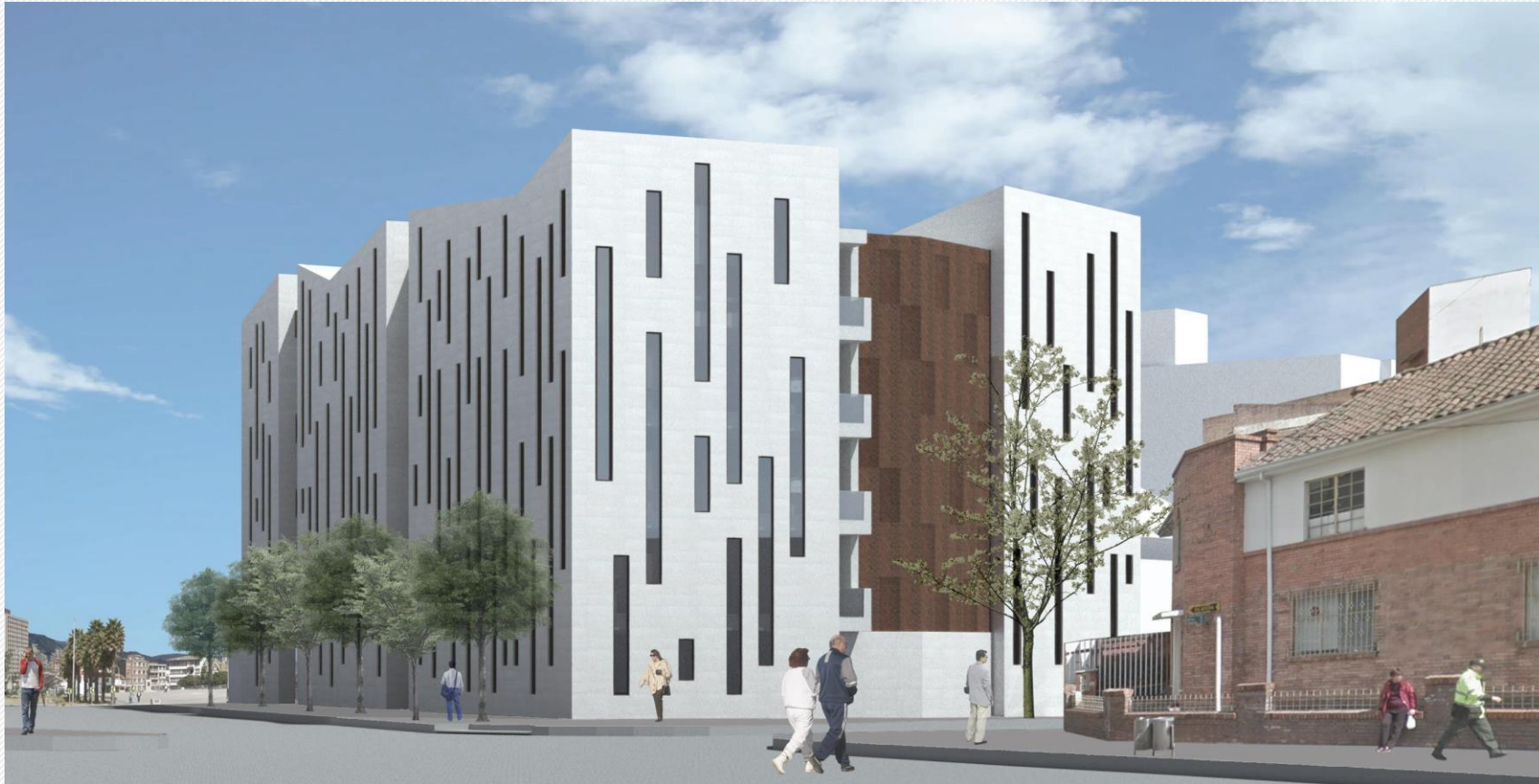
Nuevo Edificio del Concejo de Bogotá