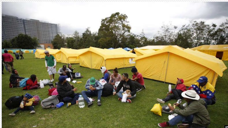
Situación de los migrantes venezolanos en el Distrito Capital