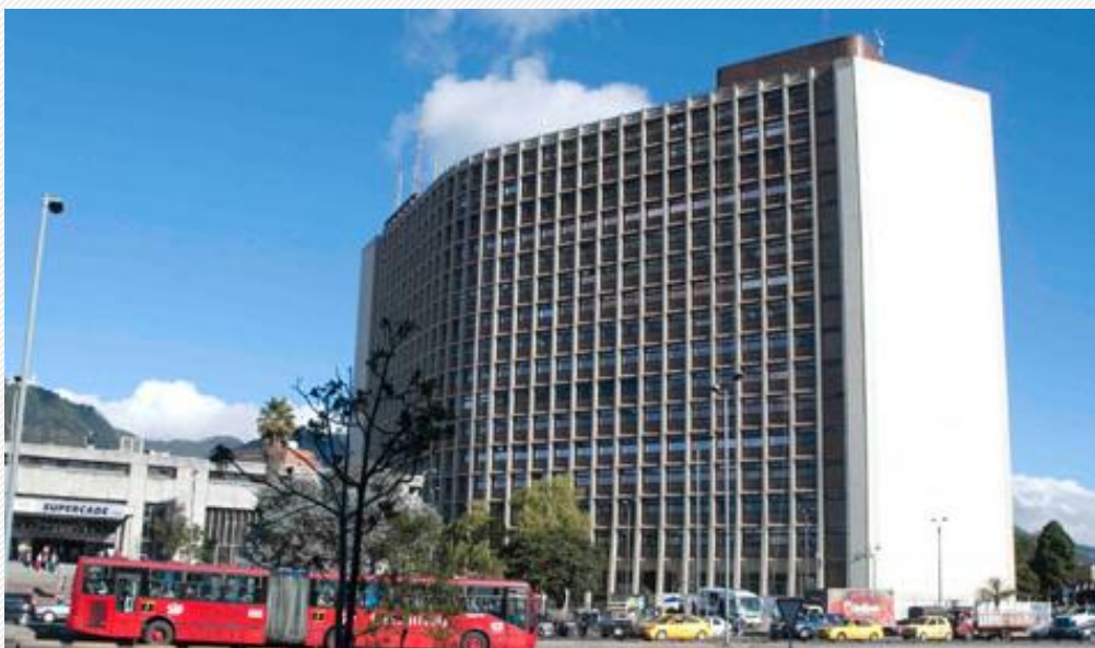
Gestión de las entidades de la Administración Distrital Sesiones ordinarias mes de Febrero