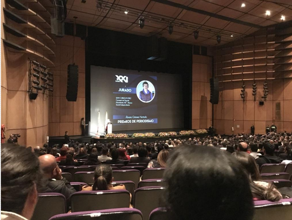
Premios Álvaro Gómez Hurtado Teatro Jorge Eliécer Gaitán