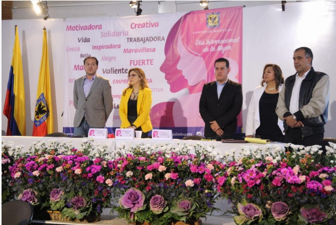
Conmemoración Día de la Mujer Plaza de los Artesanos