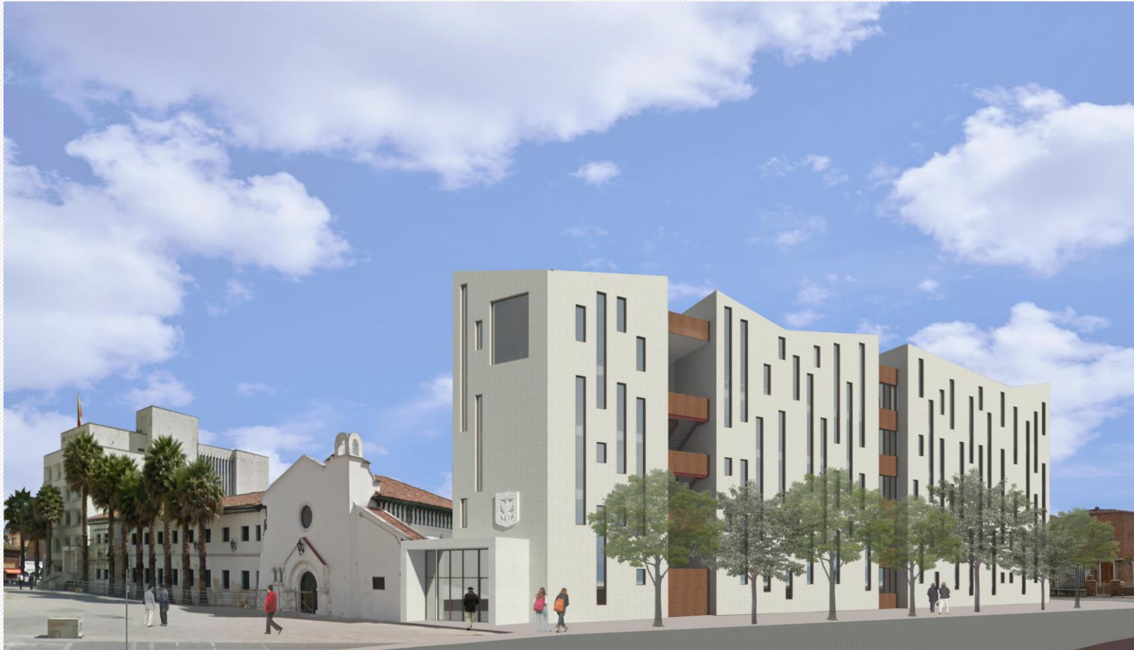
Nuevo Edificio del Concejo de Bogotá