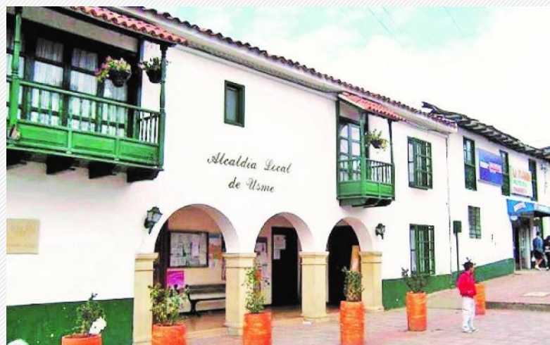
Funcionamiento de las Alcaldías Locales