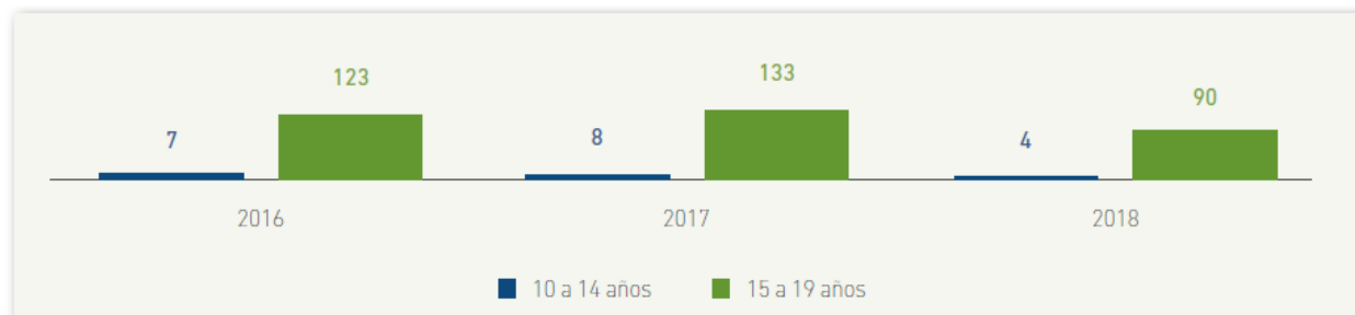
Tabla 5. Número de MORTINATOS

Fuente: Secretaría Distrital de Salud. 2016 y 2017. – Base de Datos DANE-RUAF-ND. Sistema de Estadística Vitales. –Análisis demográfico. –Finales 2018: Aplicativo –RUAF – ND. Sistema De Estadísticas Vitales – Análisis demográfico. – Preliminares.