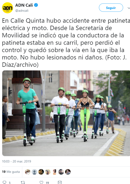
Imagen 6. https://twitter.com/adncali/status/1108413785402994689